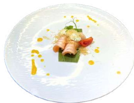
N13 Nigiri honey 2pz riso, salmone scottato con philadelphia kataifi e salsa a base di miele (4) (7)