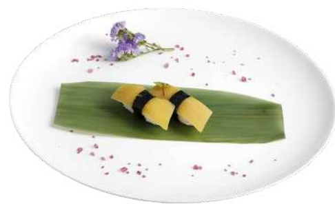
N11 Nigiri oshinko 2pz riso, alghe nori, ravanello