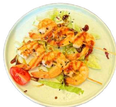
S10 Yaki ebi 2pz spiedini di gamberi alla piastra con salsa (1) (2) (11)