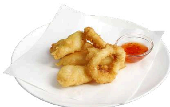
S6 Tempura di pesce misto salmone, branzino e calamari fritti (1) (4) (14)