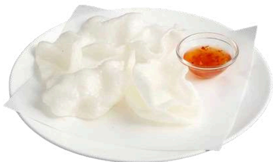
A13 Nuvolette di drago