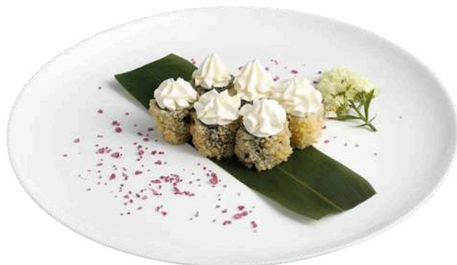
H12 Hosomaki philadelphia

riso, alghe nori, gambero cotto con salsa speciale (1) (2)