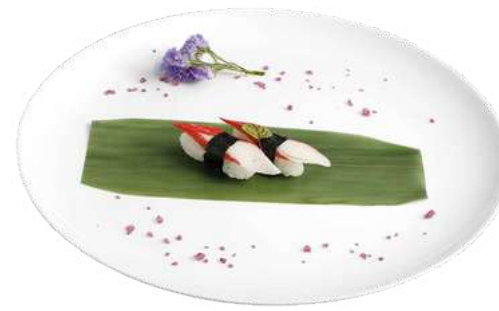
N6 Nigiri surimi 2pz riso, alghe nori, surimi (1) (2) (4)