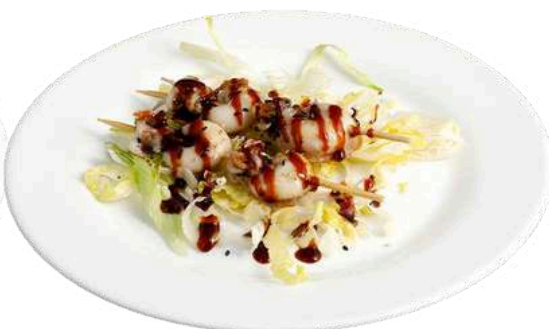
S9 Yaki ika 2pz spiedini di seppioline alla piastra con salsa (1) (4) (11)