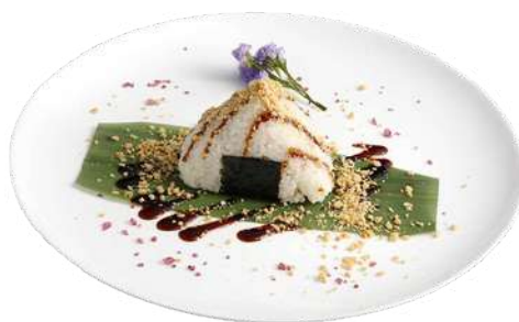
N12 Onigiri riso, alghe nori, salmone, arachidi, erba cipollina, tobiko, tabasco, salsa teriyaki (1) (3) (4) (5) (6) (11)