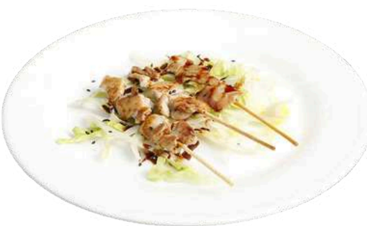
S8 Yaki tori 3pz spiedini di pollo alla piastra con salsa (1) (11)