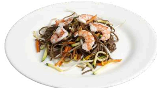
P6 Yaki soba gamberi spaghetti di grano saraceno, verdure, uova e gamberi (1) (2) (3)