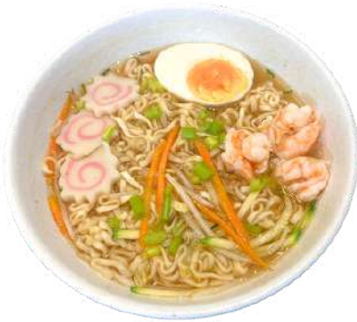
P1 Miso ramen con frutti di mare spaghetti di grano duro in brodo di miso. con surimi gamberi cotti e uova, zucchine carote (1) (2) (3)