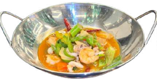
S41 Pentola fuoco pesce misto mare

anatra, pomodori, ananas, piselli (1) (6)