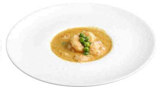
S28 Gamberi al cocco

peperoni, cipolla, arachidi e gamberi (2) (5)