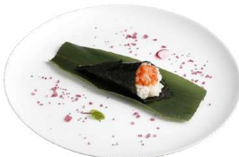
T8 Temaki spicy sake

riso, alghe nori, gamebro crudo, avocado (2)