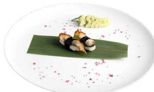
N9 Nigiri anago riso, alghe nori, anguilla (1) (4)