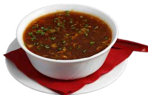
A16 Zuppa agropiccante

gamberi, carne e pesce 3pz (1) (2) (3) (4) (6)