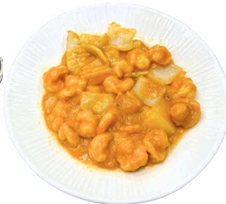
S42 - Gamberi curry

gamberi, calamari, porro, peperoni piccanti, peperoni (1) (2) (4)