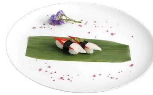
N6 Nigiri surimi 2pz riso, alghe nori, surimi (1) (2) (4)