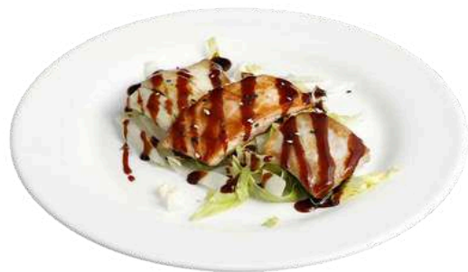
S11 Teppanyaki pesce misto

salmone, branzino e tonno alla piastra (1) (4) (11)