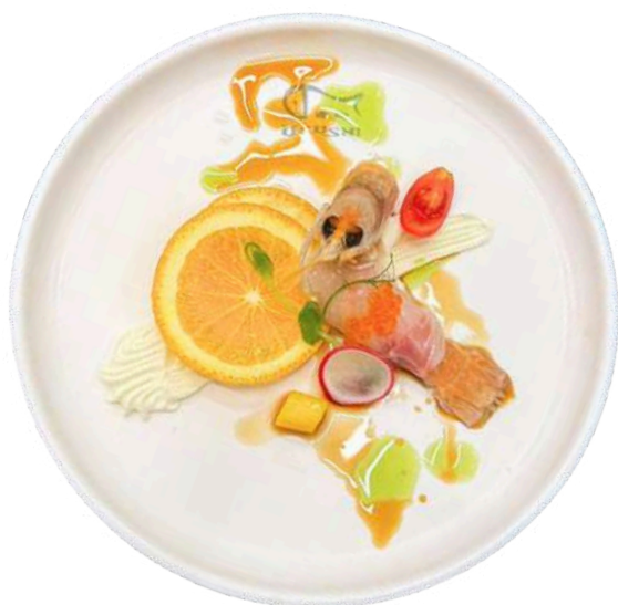
PS03 Branzino scampi

Carpaccio branzino, scampi, ikura con salsa ponzu (1) (4) (6) (7)