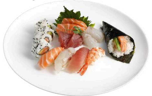
SM4 Party 1 15 pz (1) (2) (4)