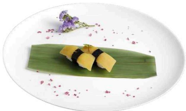
N11 Nigiri oshinko 2pz