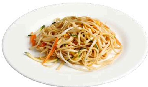
P4 Udon verdure spaghetti di grano, verdure e uova (1) (3)