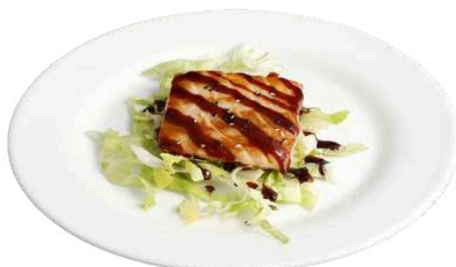
S12 Sake teppanyaki

salmone, branzino e tonno alla piastra (1) (4) (11)