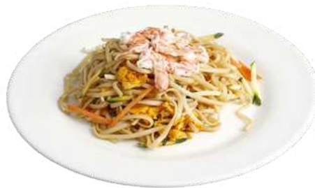
P2 Yaki udon gamberi spaghetti di grano, gamberi, verdure e uova (1) (2) (3)