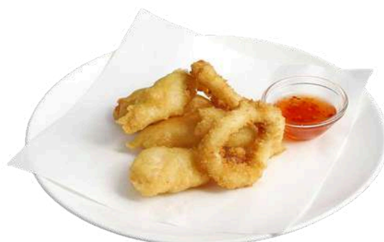
S6 Tempura di pesce misto salmone, branzino e calamari fritti (1) (4) (14)