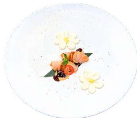
N10 Nigiri sake fume riso, salmone scottato, salsa speciale piccante, sesamo (1) (4) (11)