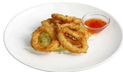
S3 Ika tempura calamari fritti (1) (14)