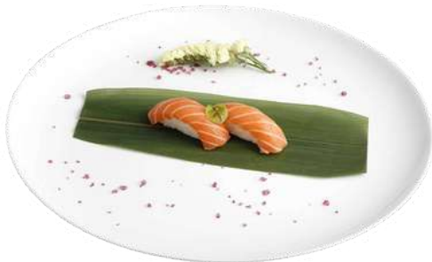
N1 Nigiri sake 2pz riso, salmone (4)