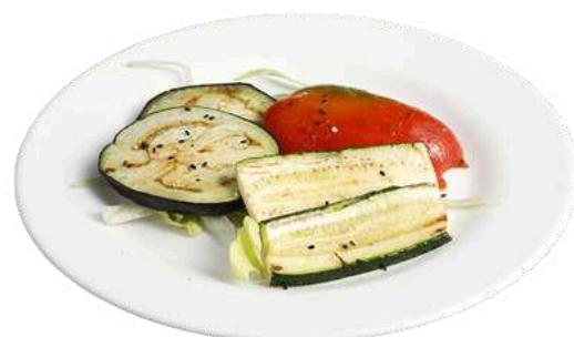
S14 Verdure miste teppanyaki

branzino alla piastra con salsa (1) (4) (11)