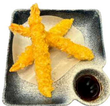
S5 Tempura ebi 3pz gamberi fritti (1) (2)