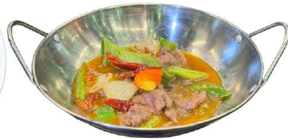
S43 Pentola fuoco manzo e verdure

gamberi con curry, bambù, cipolla (1) (7)