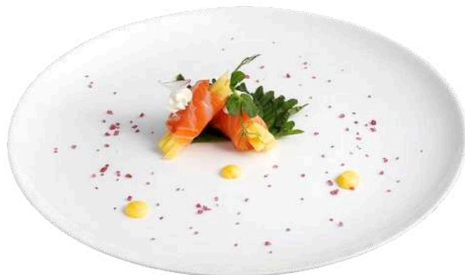
PS02 Sake fresh mango