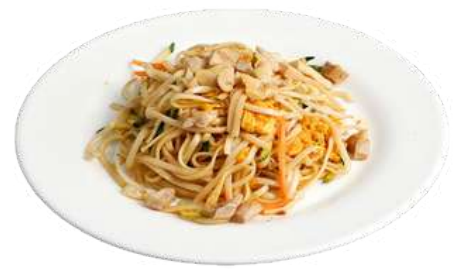
P3 Yaki udon pollo spaghetti di grano, pollo, verdure e uova (1) (3)