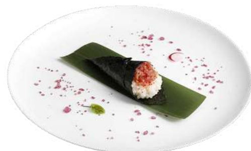
T9 Temaki spicy tuna

riso, alghe nori, salmone, erba cipollina, tabasco (4)