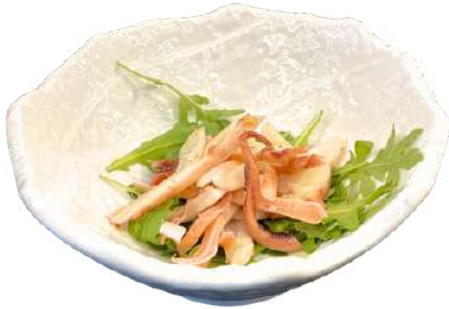
A33 Polpo rucola polpo, rucola (1) (14)