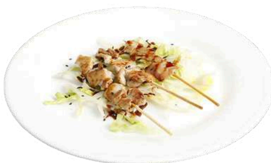
S8 Yaki tori 3pz spiedini di pollo alla piastra con salsa (1) (11)