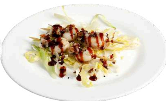
S9 Yaki ika 2pz spiedini di seppioline alla piastra con salsa (1) (4) (11)