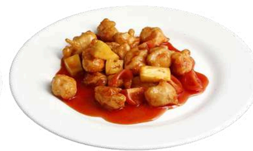
S25 Pollo in salsa agrodolce