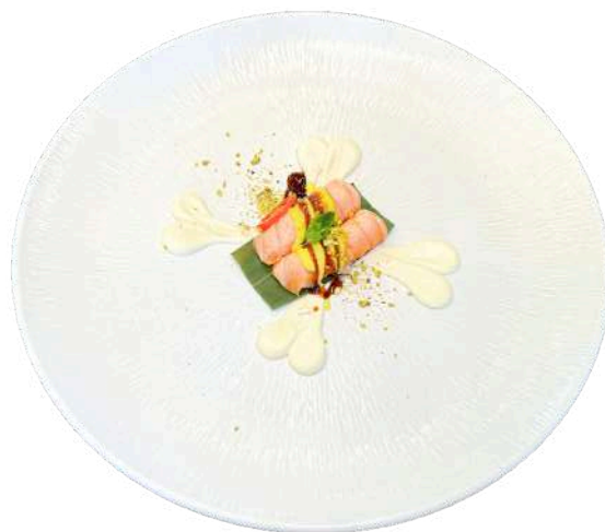
N00 Nigiri flambe 2pz

riso, salmone scottato con philadelphia kataifi e salsa a base di miele (4) (7)