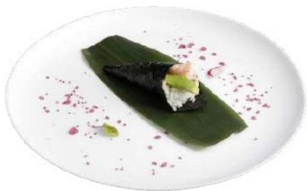
T1 Temaki california

riso, alghe nori, gamberi cotti, avocado, tonno, maionese (2) (3) (4)