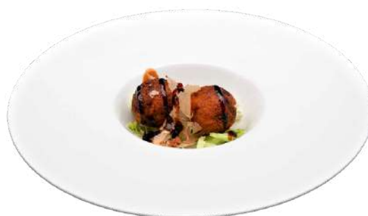
A20 Polpette fritte di polipo e patate

pane cinese ripieno di crema all'uovo 2pz (1) (3) (7)