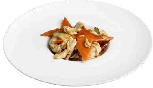
S16 Pollo con verdure saltate

pollo con carote, zucchine e germogli di soia (1)