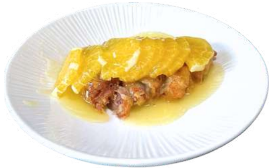
S38 Anatra arancia