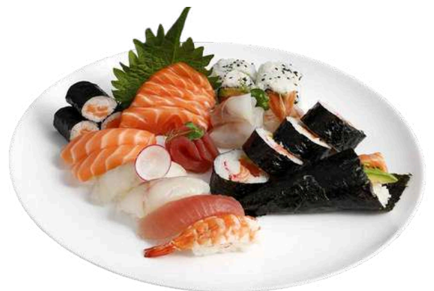
SM6 Party 3 30PZ (1) (2) (3) (4) (7) (8)