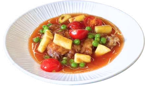
S40 Anatra in salsa agrodolce

anatra, pomodori, ananas, piselli (1) (6)