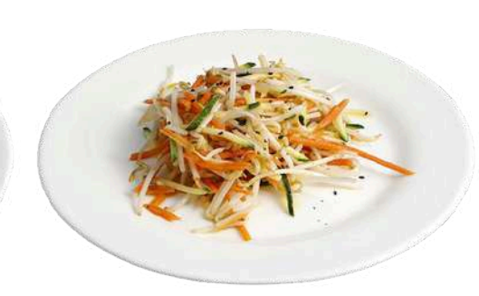
S19 Verdure miste saltate

gamberi con carote, zucchine e germogli di soia (1) (2) (6)