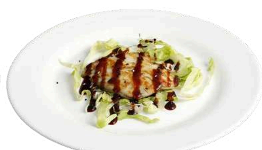
S13 Suzuki teppanyaki

salmone alla piastra con salsa (1) (4) (11)