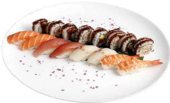
SM3 Sushi misto 16pz 8 nigiri e 8 uramaki (1) (2) (4)