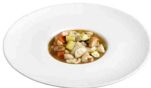
S20 Pollo alle mandorle

pollo con mandorle, carote, zucchine (1) (8)