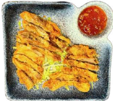
S39 Anatra fritto