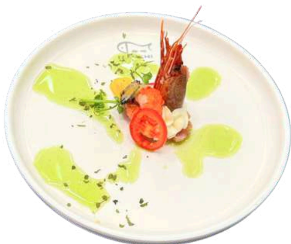
PS08 Golden tonno

Fiori di zucca fritti, salmone, pistacchio e salsa a base d'anguilla (1) (4) (6) (8)