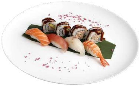
SM1 Sushi misto 8pz 4 nigiri e 4 uramaki (1) (2) (4)