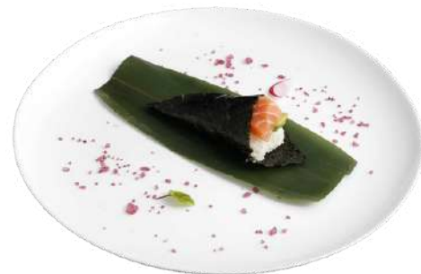
T3 Temaki sake