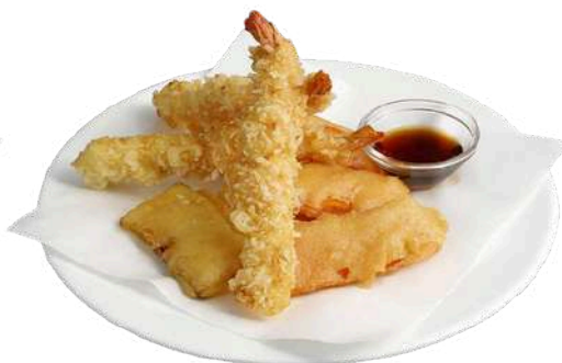
S2 Tempura mista verdure e gamberi fritti (1) (2)