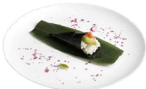
T4 Temaki philadelphia

riso, alghe nori, salmone, philadelphia e avocado (4) (7)