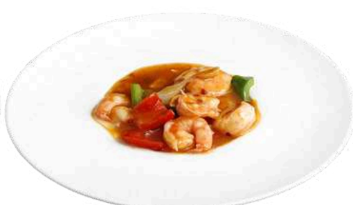
S27 Gamberi stile impero

peperoni, cipolla, arachidi e pollo (1) (5)