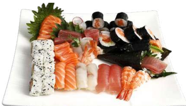
SM7 Party 4 48PZ (1) (2) (3) (4) (7) (8)