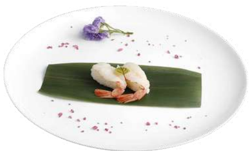
N8 Nigiri amaebi riso, alghe nori, gambero crudo (2)