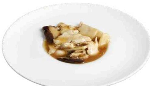
S21 Pollo funghi e bambù

pollo con mandorle, carote, zucchine (1) (8)