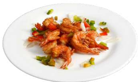
S23 Gamberi sale e pepe