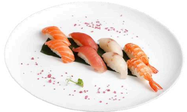
SM2 Nigiri misto 8pz riso, salmone, tonno, branzino, gamberi cotti (2) (4)