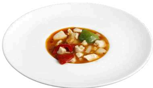
S26 Pollo stile impero

peperoni, cipolla, arachidi e pollo (1) (5)