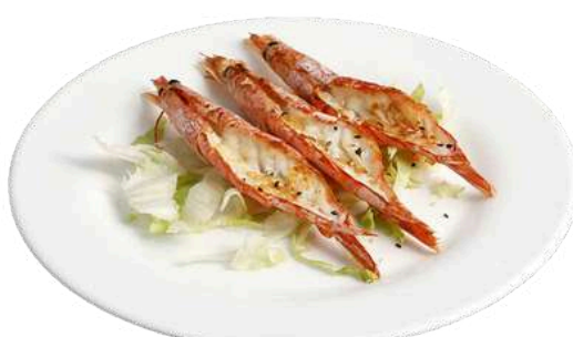
S15 Ebi teppanyaki

peperoni, melanzane e zucchine alla piastra