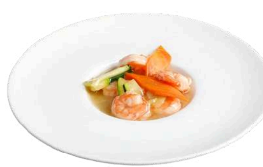
S18 Gamberi con verdure saltate

gamberi con carote, zucchine e germogli di soia (1) (2) (6)