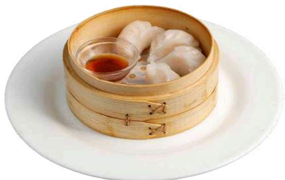
A15 Ravioli di gamberi

gamberi, carne e pesce 3pz (1) (2) (3) (4) (6)