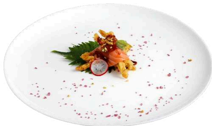
PS04 Fiori di zucca

Carpaccio branzino, scampi, ikura con salsa ponzu (1) (4) (6) (7)