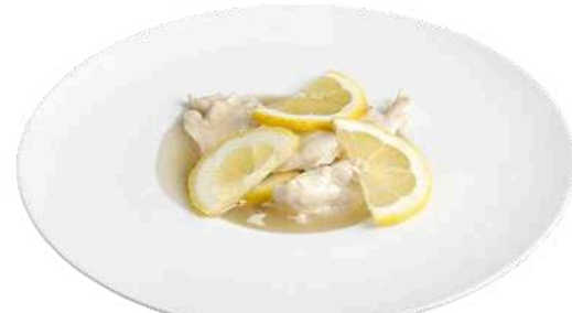
S22 Pollo al limone