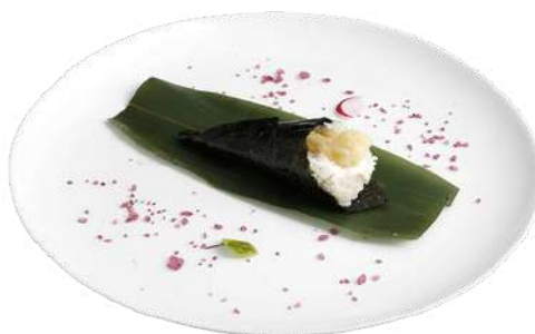
T5 Temaki ebi

riso, alghe nori, salmone, philadelphia e avocado (4) (7)