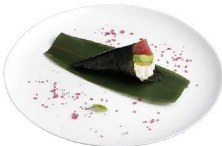
T2 Temaki maguro

riso, alghe nori, gamberi cotti, avocado, tonno, maionese (2) (3) (4)