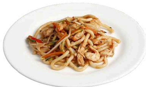
P5 Yaki udon fish spaghetti nama udon di grano con pesce misto e verdure (1) (4)