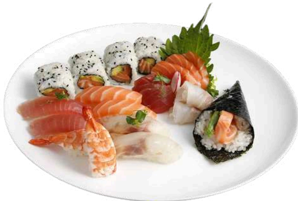
SM5 Party 2 27PZ (1) (2) (3) (4) (7) (8) (14)