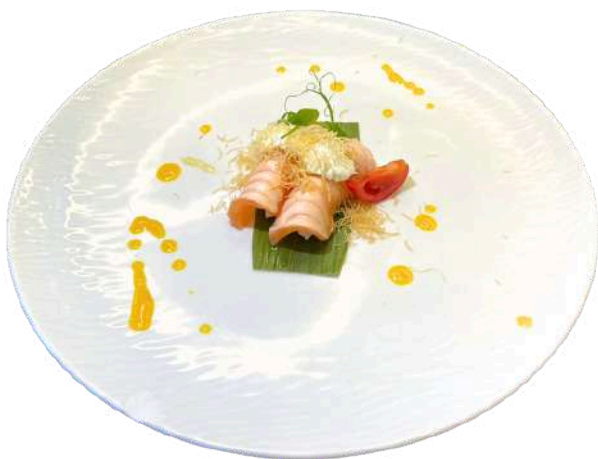
N13 Nigiri honey 2pz

riso, alghe nori, salmone, arachidi, erba cipollina, tobiko, tabasco, salsa teriyaki (1) (3) (4) (5) (6) (11)