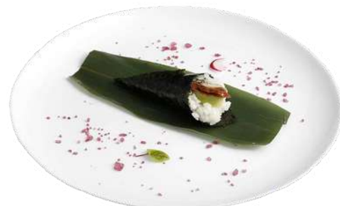
T6 Temaki anago

riso, alghe nori, gambero in tempura, maionese (1) (2) (3)