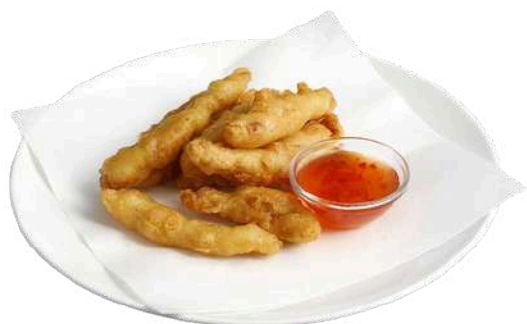
S4 Tempura di pollo pollo fritto (1)