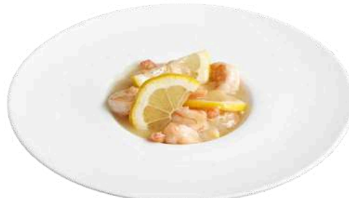
S24 Gamberi al limone