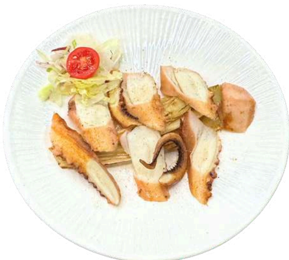
S45 Polpo alla piastra

fette di manzo con le peperoni dolce e peperoni piccanti e cipolla porro (1) (11)