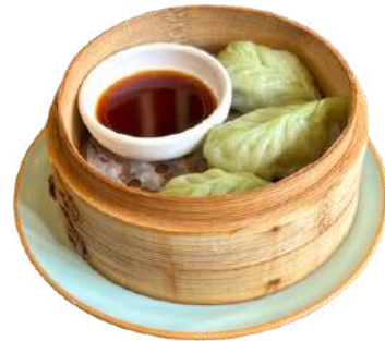
A34 Ravioli verdure cavoli, carote, spaghetti di soia (1) (6)