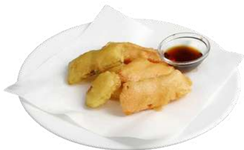
S1 Yasai tempura carote, zucchine, zucca e patate (1)