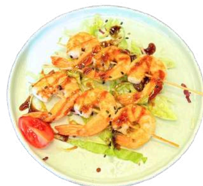
S10 Yaki ebi 2pz spiedini di gamberi alla piastra con salsa (1) (2) (11)