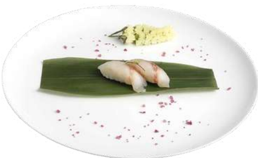
N4 Nigiri suzuki 2pz riso, branzino (4)