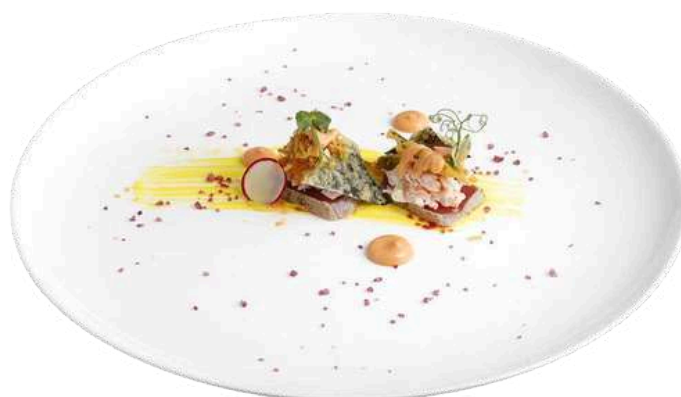
PS09 Ebi roll

Gambero rosso di sicilia, sashimi tonno scottato, philadelphia, ikura, tartufo e salsa verde (2) (4) (6) (7)