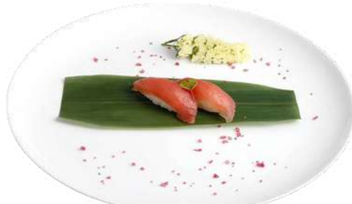
N2 Nigiri maguro 2pz riso, tonno (4)