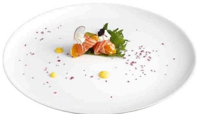
PS01 Sake fresh arancia