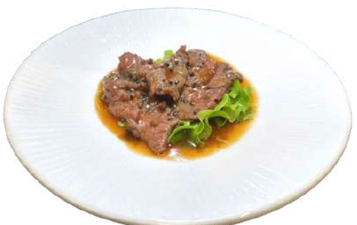
S17 Manzo alla piastra

pollo con carote, zucchine e germogli di soia (1)