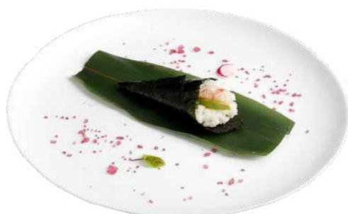
T7 Temaki amaebi

riso, alghe nori, anguilla, avocado, maionese, teriyaki (1) (3) (4)