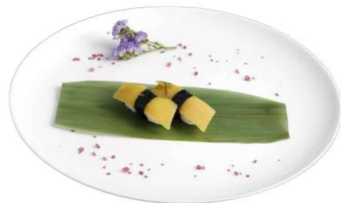
N11 Nigiri oshinko 2pz riso, alghe nori, ravanello