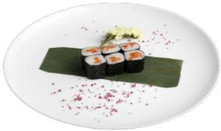
H1 Sakemaki riso, alghe nori, salmone (4)