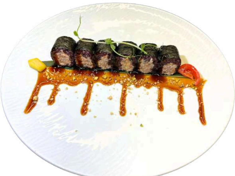
H17 Hosso black miura

riso, alghe nori, surimi, philadelphia (1) (2) (4) (7)