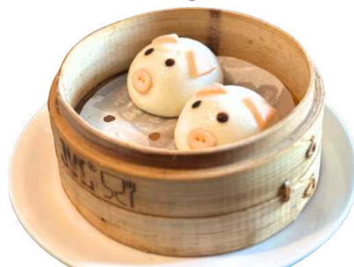
A22 Pane ripieno

pane cinese ripieno di crema all'uovo 2pz (1) (3) (7)