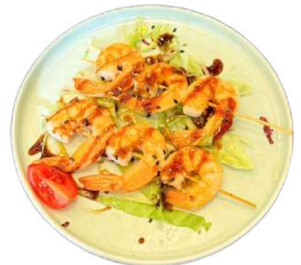
S10 Yaki ebi 2pz spiedini di gamberi alla piastra con salsa (1) (2) (11)