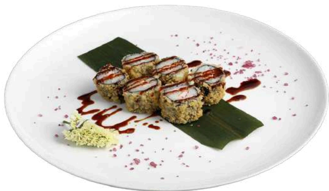
H10 Ebimaki in tempura

riso, alghe nori, gambero cotto con salsa speciale (1) (2)