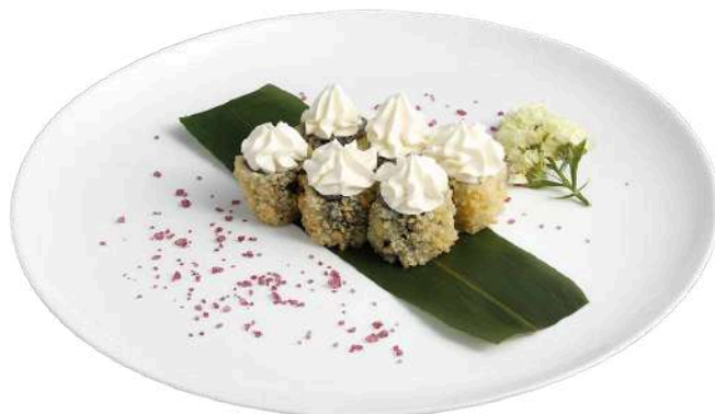
H12 Hosomaki philadelphia

riso, alghe nori, gambero cotto con salsa speciale (1) (2)