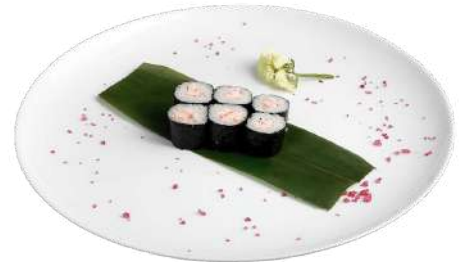
H3 Ebimaki riso, alghe nori, gamberi cotti (2)