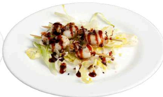
S9 Yaki ika 2pz spiedini di seppioline alla piastra con salsa (1) (4) (11)