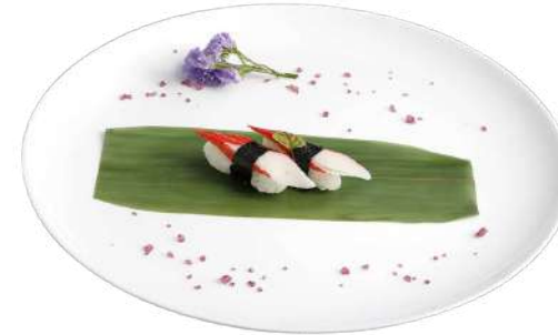
N6 Nigiri surimi 2pz riso, alghe nori, surimi (1) (2) (4)