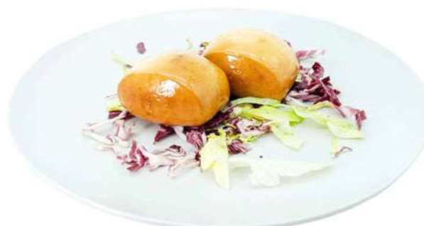
A24 Mantou fritto