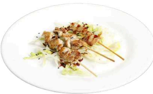
S8 Yaki tori 3pz spiedini di pollo alla piastra con salsa (1) (11)