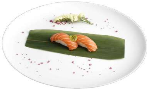
N1 Nigiri sake 2pz riso, salmone (4)