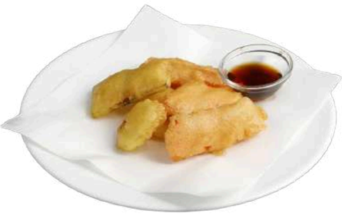
S1 Yasai tempura carote, zucchine, zucca e patate (1)