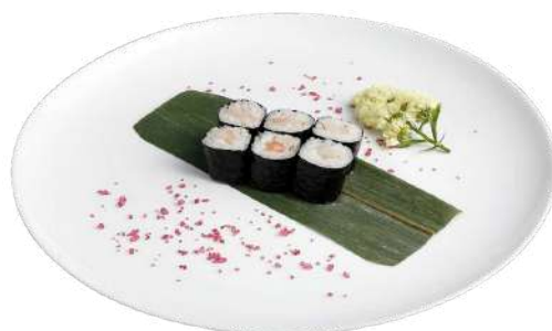
H8 Amamaki riso, alghe nori, gamberi crudi (2)