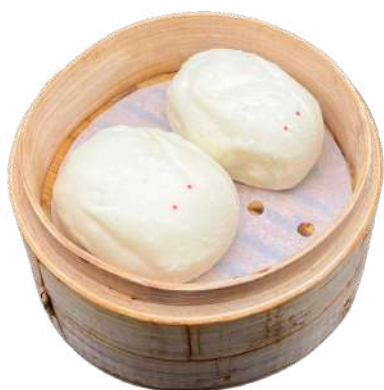
A19 Pane dolce

pane cinese ripieno di crema all'uovo 2pz (1) (3) (7)