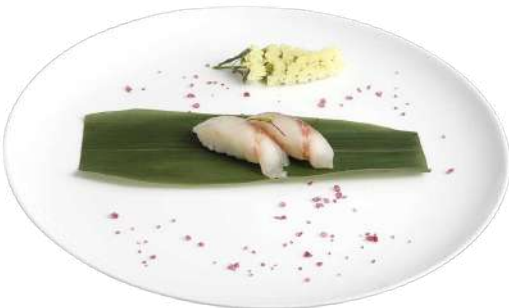
N4 Nigiri suzuki 2pz riso, branzino (4)