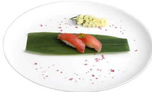
N2 Nigiri maguro 2pz riso, tonno (4)