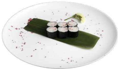
H4 Kanimaki riso, alghe nori, surimi (2) (4)