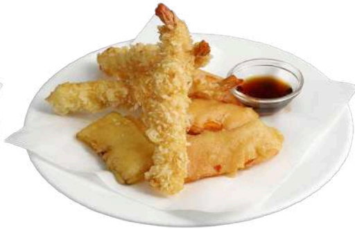
S2 Tempura mista verdure e gamberi fritti (1) (2)