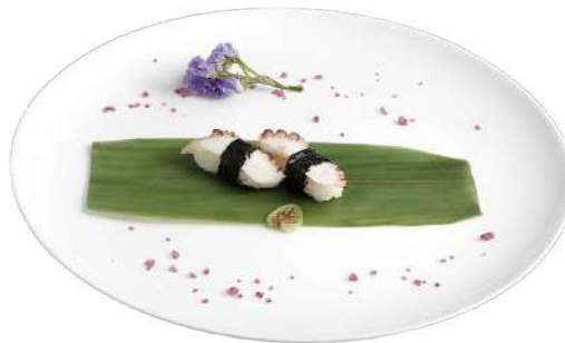
N5 Nigiri tako 2pz riso, alghe nori, polpo (1) (14)