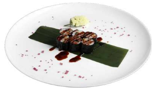
H9 Hosomaki anguilla riso, alghe nori, anguilla (1) (4)