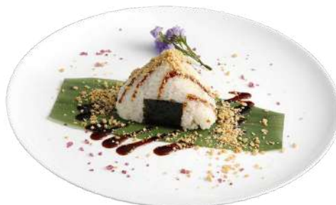
N12 Onigiri riso, alghe nori, salmone, arachidi, erba cipollina, tobiko, tabasco, salsa teriyaki (1) (3) (4) (5) (6) (11)