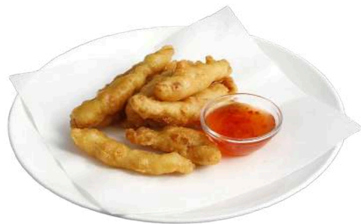
S4 Tempura di pollo pollo fritto (1)