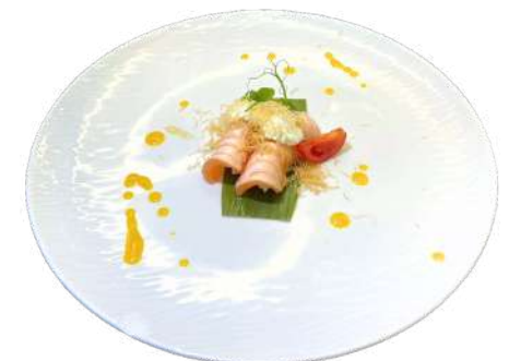
N13 Nigiri honey 2pz riso, salmone scottato con philadelphia kataifi e salsa a base di miele (4) (7)