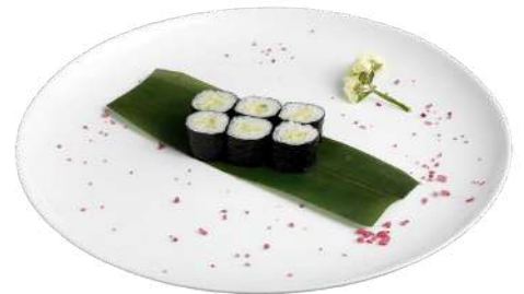
H6 Kappamaki riso, alghe nori, certriolo