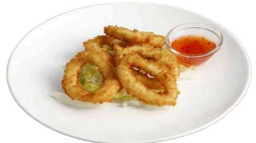
S3 Ika tempura calamari fritti (1) (14)