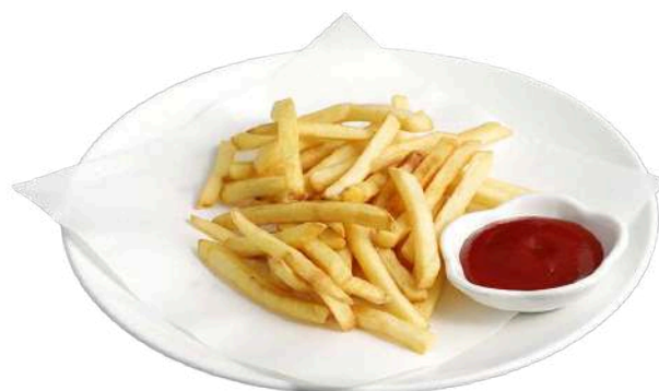
A14 Patatine fritte