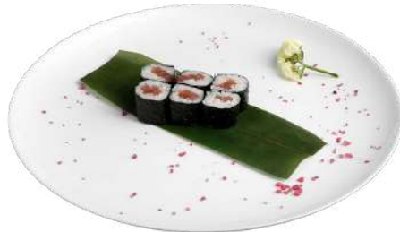
H2 Tekamaki riso, alghe nori, tonno (4)