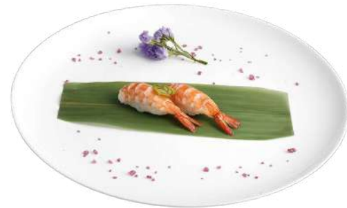
N3 Nigiri ebi 2pz riso, gamberi cotti (2)