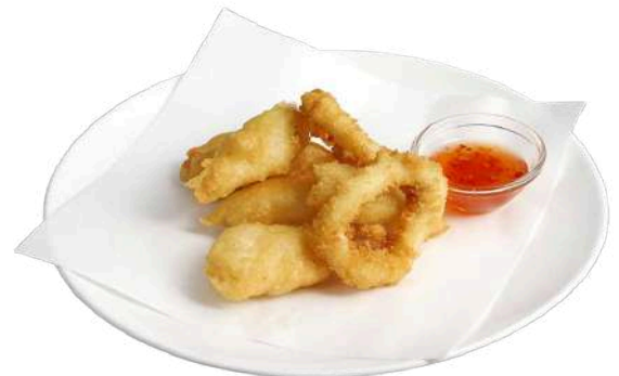
S6 Tempura di pesce misto salmone, branzino e calamari fritti (1) (4) (14)