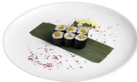
H5 Hosomaki oshinko riso, alghe nori, ravanello