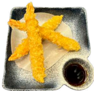
S5 Tempura ebi 3pz gamberi fritti (1) (2)