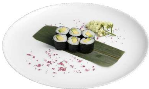
H7 Hosomaki avocado riso, alghe nori, avocado