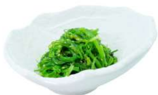
A4 Wakame alghe aromatizzate al sesamo (1) (11)