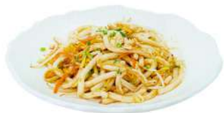
P10 Udon spicy

spaghetti udon con verdure e gamberi (1) (2) (4)