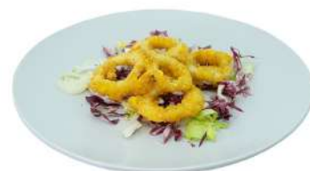
S3 Tempura ika anelli di calamari (1) (14)