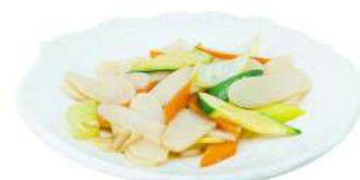
P12 Gnocchi di riso verdure

spaghetti di grano saraceno con verdure, gamberi e uova (1) (2) (3)