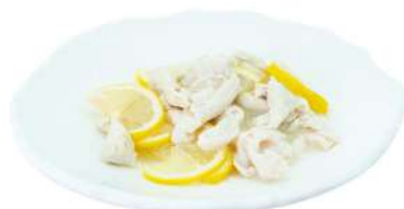
S15 Pollo limone pollo in salsa limone