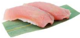
N2 Nigiri maguro tonno pinna gialla, riso (4)