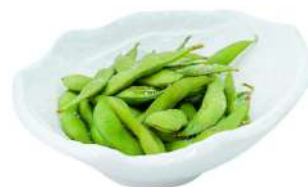
A3 Edamame fagioli di soia (6)