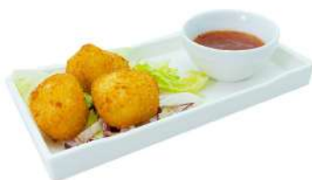
A5 Polpette di patate 3pz patata e mais (1) (3) (7)