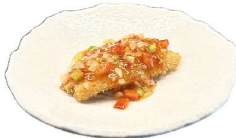
S33 Branzino agropiccante branzino in tempura con salsa agropiccante (1) (3) (4)