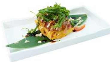
Z9 Crisp maguro 1pz riso fritto, tartare di tonno, rucola fritta, pomodoro, salsa mango e teriyaki (1) (4) (6)