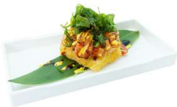
Z8 Crisp salmon 1pz riso fritto, tartare di salmone, rucola fritta, pomodoro, salsa mango, salsa teriyaki (1) (4) (6)