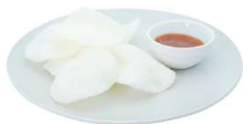
A1 Nuvole di drago patatine al gusto gambero (2)