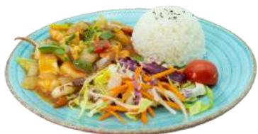
P7 Kaisen donburi