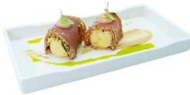
Z5 Tataki tuna 2pz patata avvolta nel tatakisalmone e salsa tokarashi (1) (4)