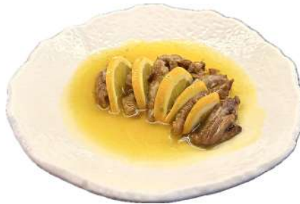
S30 Anatra arancia anatra in salsa d'arancia (1)