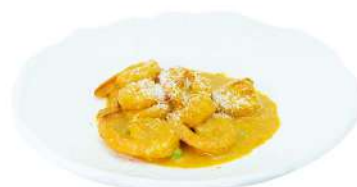
S25 Gamberi al cocco gamberi e piselli in salsa al cocco speziato (2)