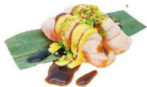
N10 Salmon plus salmon flamé, salsa teriyaki, salsa mango (1) (4) (6)