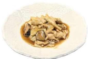
S17 Pollo funghi e bambù pollo con funghi e bambù (1) (6)