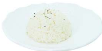
P2 Riso bianco