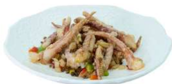
S27 Tentacoli di calamari sale e pepe calamari, peperoni e pepe del sichuan (14)