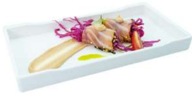
Z4 Tataki sake 2pz cavolo viola avvolta nel tatakisalmone e salsa tokarashi (1) (4)