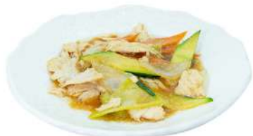
S14 Pollo verdure pollo, carote, zucchine e cipolla