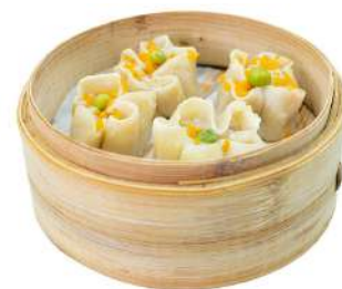
A12 Shaomai 4pz carne suina e gamberi (1) (2) (4)