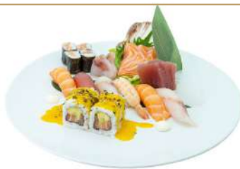
SM2 Sushi Mix 20pz

6 nigiri, 3 hosomaki, 4 uramaki, 7 sashimi (1) (2) (4)