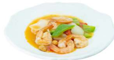
S22 Gamberi piccanti gamberi, peperoni, cipolla e arachidi (2) (8)