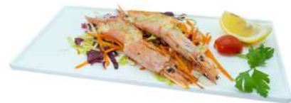
S43 Gamberoni teppanyaki gamberoni alla piastra 5pz (2)