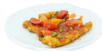
S16 Pollo agrodolce pollo fritto con salsa agrodolce (1)