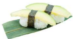
N7 Nigiri avocado avocado, riso