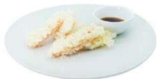
S1 Tempura yasai carote, zucchine, patata dolce, zucca (1)