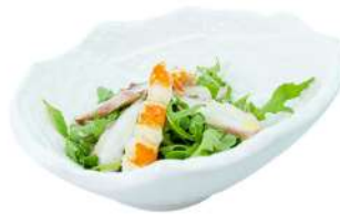
A34 Insalata di polipo rucola, polipo e surimi (2) (14)