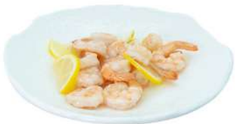
S20 Gamberi al limone gamberi in salsa limone (2)