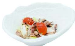
A8 Tako wasabi polipo, cetrioli, pomodorini e salsa aromatizzato al wasabi (1) (14)