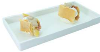
Z2 Millefoglie tuna 2pz chips croccante, tonno, bufala, carciofi e salsa tartufo (1) (4)