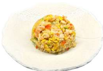
P8 Riso con gamberi

riso, verdure, gamberi, uova (1) (2) (3)