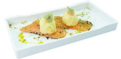
Z6 Sake patata 2pz patata, tatakisalmone, pistacchio e salsa tokarashi (1) (4) (8)