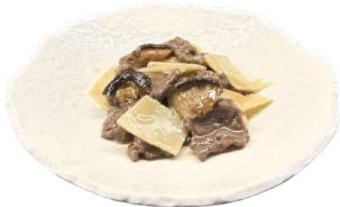
S32 Manzo funghi e bambù manzo con funghi e bambù (1) (6)