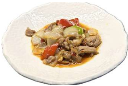
S29 Anatra piccante anatra in salsa piccante (5)