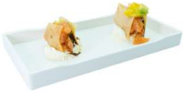
Z1 Millefoglie salmon 2pz chips croccante, salmone, bufala, oliva e salsa balsamico, frutta mista (1) (4)