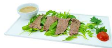
A9 Rucola beef manzo alla piastra su letto di rucola (11)