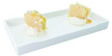
Z3 Millefoglie ebi 2pz chips croccante, gambero crudo, bufala, frutta, salsa avocado, salsa yuzu (2)