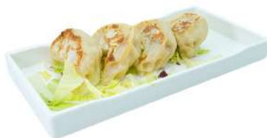
A11 Gyoza alla piastra 4pz carne suina e verdure (1) (11)