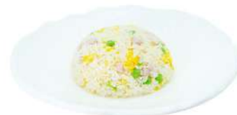
P3 Riso Cantonese