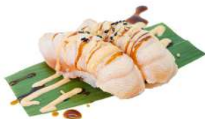
N8 Nigiri sake flambé salmone flambé con teriyaki e mayopiccante (1) (3) (4)