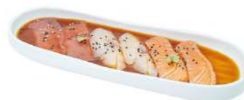
M6 Carpaccio Mix

salmon con salsa ponzu e sesamo (1) (4) (11)