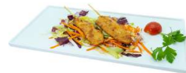
S46 Yaki tori 2pz spiedini di pollo alla piastra