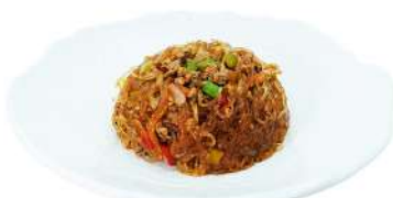
P14 Spaghetti di soia piccante peperoni, cipolla e carne suina piccante, spaghetti di soia (1) (6)