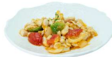
S13 Pollo piccante pollo, peperoni, cipolla e arachidi (8)