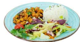
P6 Pollo donburi