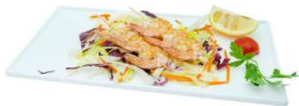
S44 Yaki ebi 2pz spiedini di gamberi alla piastra (2)