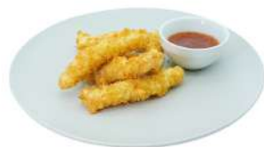
S4 Tempura pollo pollo fritto (1)