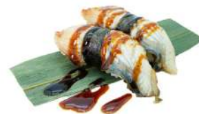
N6 Nigiri unagi anguilla, riso, salsa teriyaki (4)