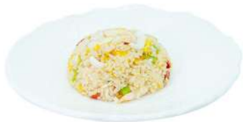
P4 Riso con frutti di mare

verdure, gamberi, calamari e uova (1) (2) (3) (4) (14)