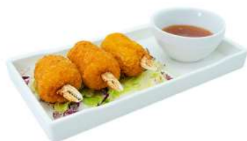
A7 Chele di granchio 3pz (1) (2)