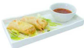
A2 Involtini primavera 2pz cavolo, cipolla, carote (1) (3)