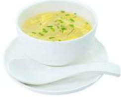
A29 Zuppa mais e pollo mais, pollo e uova (3)