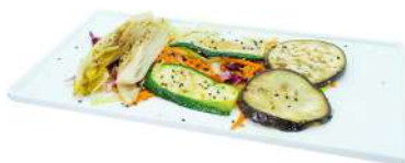
S48 Yasai teppanyaki verdure miste alla griglia