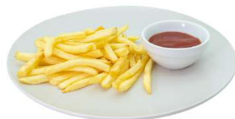
A6 Patatine patatine fritte (1)