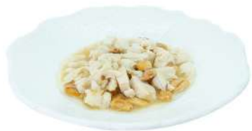
S11 Pollo mandorle pollo con mandorle (1) (6) (8)