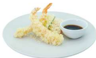
S2 Tempura misto verdure e gamberi (1) (2)