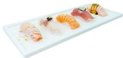
SM1 Nigiri Selection 5pz