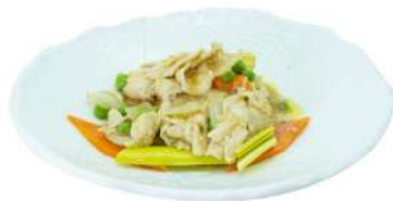
S12 Pollo al curry pollo, carote, piselli, cipolla e curry