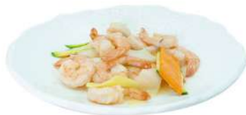
S21 Gamberi e verdure miste gamberi, carote, zucchine e cipolla (2)