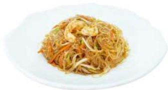
P13 Spaghetti di soia con gamberi verdure e gamberi, spaghetti di soia (1) (2) (6)