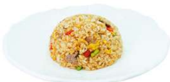
P5 Riso con manzo

verdure, gamberi, calamari e uova (1) (2) (3) (4) (14)