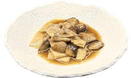
S31 Anatra funghi e bambù anatra con funghi e bambù (1) (6)