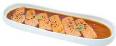
M5 Carpaccio sake

salmon con salsa ponzu e sesamo (1) (4) (11)