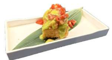
Z10 Crisp mediterraneo riso fritto, tartare di salmone, guacamole e tartare di pomodorini (1) (3) (6) (7)