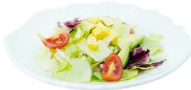
A31 Insalata Insalata con mango e avocado