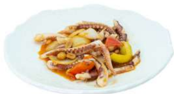
S26 Tentacoli di calamari piccante calamari, peperoni, cipolla e arachidi (14)