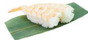
N3 Nigiri ebi gamberi cotti, riso (2)