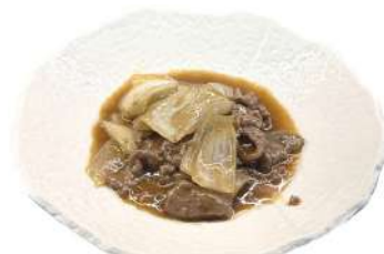
S18 Manzo con cipolla manzo e cipolla in salsa (1) (6)