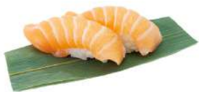
N1 Nigiri sake salmone, riso (4)