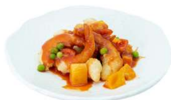
S24 Gamberi agrodolce gamberi fritti con salsa agrodolce (1) (2)