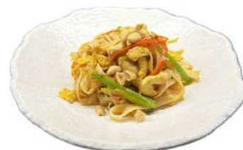
P18 Phad Thai tagliatelle di riso con verdure, pollo, arachidi e piccante (1) (3) (5)