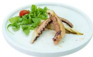
S47 Tako teppanyaki tentacoli di polipo alla piastra (14)