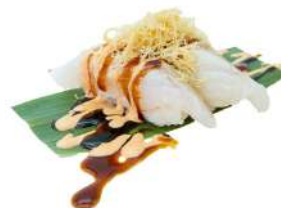
N9 Nigiri suzuki flambé branzino flambé con kataifi, teriyaki e mayopiccante (1) (3) (4)