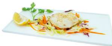
S42 Suzuki teppanyaki branzino alla piastra (4)