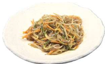
P16 Spaghetti di soia con verdure carote, zucchine, germogli di soia e spaghetti di soia (1) (6)