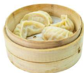
A10 Gyoza 4pz carne suina, zenzero e verdure (1) (11)