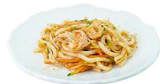
P9 Udon ebi

riso, verdure, gamberi, uova (1) (2) (3)