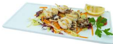
S45 Yaki Ika 2pz spiedini di seppie alla piastra (14)