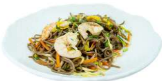
P11 Soba ebi

spaghetti udon con verdure, pollo, uova e piccante (1) (3)