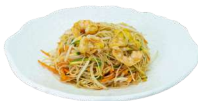
P17 Spaghetti di riso con gamberi verdure, gamberi, uova e spaghetti di riso (1) (2) (3) (6)