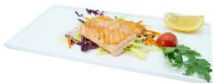
S41 Sake teppanyaki salmone alla piastra (4)