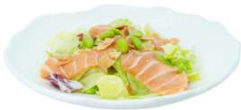
A33 Insalata con salmone e edamame salmone, fagioli di soia e salsa sesamo (4) (6)