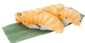
N11 Tataki salmon tataki salmone e salsa tokarashi (1) (3) (4)