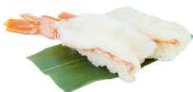
N5 Nigiri amaebi gamberi crudi, riso (2)