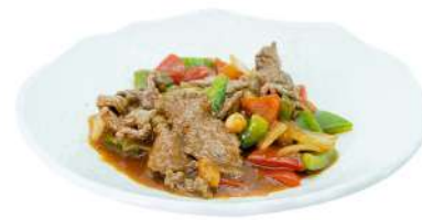
S19 Manzo piccante manzo peperoni, cipolla e arachidi (5)