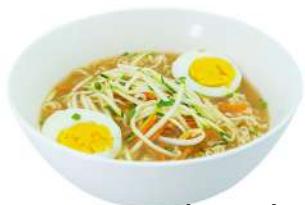
P1 Ramen in brodo