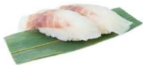
N4 Nigiri suzuki branzino, riso (4)