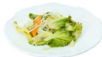
S28 Verdure miste saltate carote, zucchine, insalata e germogli (6)