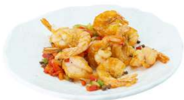
S23 Gamberi sale e pepe gamberi, peperoni e pepe del sichuan (2)