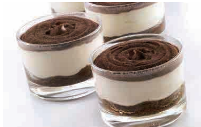
D10.COPPA TIRAMISU € 5.00