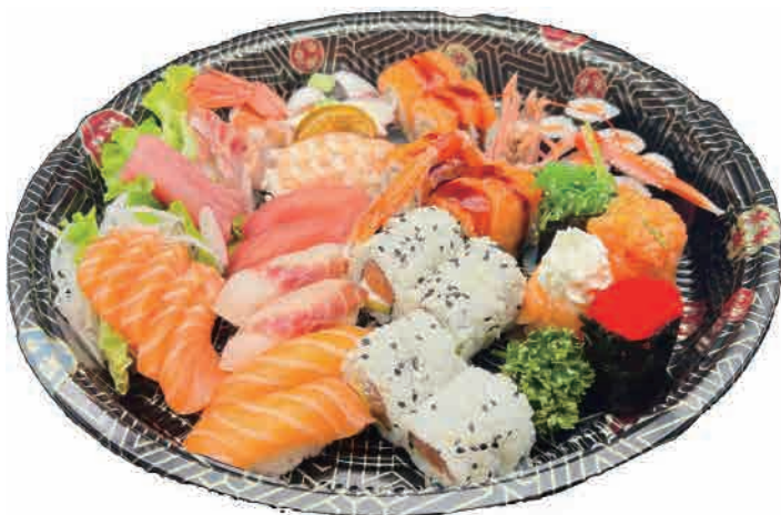
SM5.SUSHI PARTY 50PZ