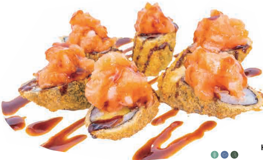
H10.HOSO SAKE FURAI € 6.00

hoso fritto con salmone,philadelphia,mango e salsa mango fried hoso with salmon,mango,mango sauce frittierter hoso mit lachs,mango,mangosauce