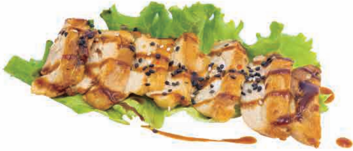
S07.POLLO ALLA PIASTRA € 6.00

pollo alla piastra con salsa grilled chicken with sauce gegrilltes hähnchen mit soße