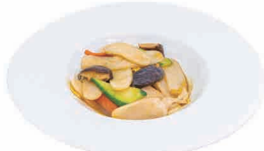
P20.GNOCCHI DI RISO € 6.00

spaghetti di riso,frutti di mare e uova rice noodles,seafood and eggs reisnudeln, meeresfrüchte und eier