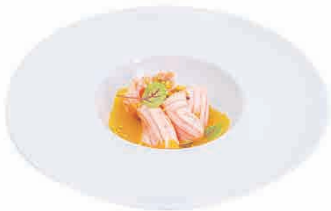
PS23.SAKE MANGO € 6.00

salmone scottato,salsa mango,pistacchio seared salmon,mango sauce,pistachio gebratener lachs,mangosauce,pistazien