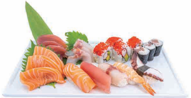
SM2.SUSHI FAMILY 12PZ