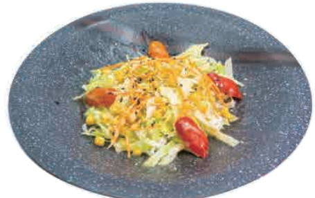
A07.YASAI SALAD € 5.00

insalata con misto pesce salad with mixed fish salat mit gemischtem fisch