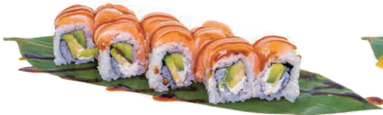
U21.URAMAKI PHILA ROLL € 8.00

salmone,philadelphia,avocado,tartare di salmone,pistacchio salmon,philadelphia,avocado,salmon tartare,pistachio lachs,philadelphia,avocado,lachstatar,pistazien