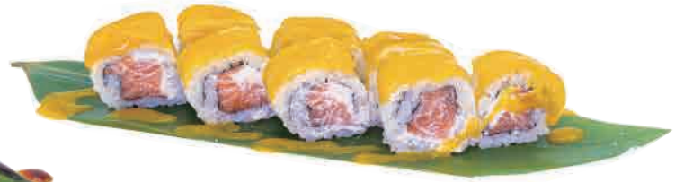
U22.URAMAKI MANGO € 8.00

salmone,avocado,philadelphia,teriyaki salmon,avocado,philadelphia,teriyaki lachs,avocado,philadelphia,teriyaki