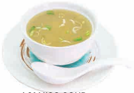
A01.MISO SOUP € 5.00

miso,tofu,erba cipollina e alghe miso,tofu,chives and seaweed miso,tofu,schnittlauch und algen