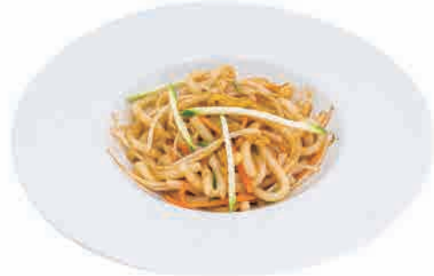
P04. YAKI UDON VERDURE € 6.00

spaghetti udon di grano con pollo, zucchini, carote, germogli di soia e uova wheat noodles with chicken, zucchinis, carrots, bean sprouts and eggs weizen-udon-nudeln mit hühnerfleisch, zucchini, karotten, sojasprossen und eiern