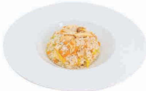
P11.RISO CON POLLO € 6.00

riso con gamberi, uova e verdure rice with shrimps, eggs and vegetables reis mit garnelen, eiern und gemüse