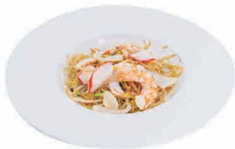
P19.SPAGHETTI DI RISO CON I FRUTTI DI MARE € 6.00

spaghetti di riso,pollo,verdure e uova rice noodles,chicken,vegetables and eggs reisnudeln, huhn, gemüse und eier