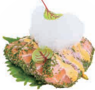
PS7.SAKE TATAKI € 6.00

salmone, gambero in tempura, philadelphia, teriyaki salmon, shrimp tempura, philadelphia, teriyaki lachs, tempura-garnelen, philadelphia, teriyaki