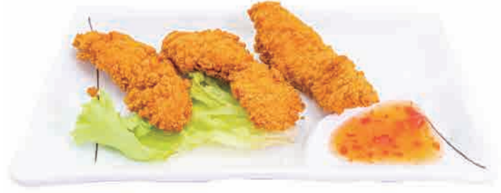
S04.TEMPURA DI POLLO

calamari fritti fried squid rings fritierter tintenfisch