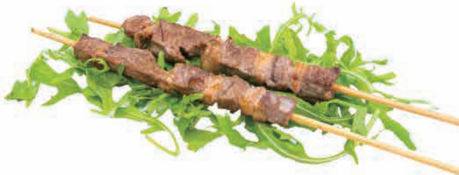
S11.SPIEDINI DI AGNELLO € 6.00 / 5pz

spiedini di gamberi alla piastra con salsa grilled shrimp skewers with sauce gegrillte garnelenspieße mit sauce