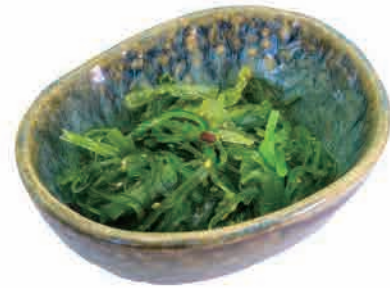
A04.WAKAME € 5.00

tofu,funghi cinesi,bambù,carote,piselli e uova tofu,wood-ear,bamboo,carrots,peas and eggs tofu, chinesische pilze, bambus, karotten, erbsen und eier