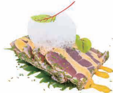
PS11.TUNA TATAKI € 6.00

salmone scottato, prezzemolo, salsa piccante, schiuma seared salmon, parsley, hot sauce, foam gebratener lachs, Petersilie, scharfe Soße, schaum