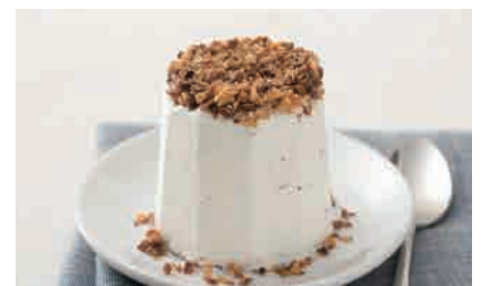
D14.TORRONCINO € 4.00