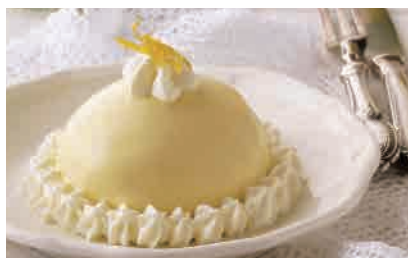
D13.DELIZIA LIMONE € 4.00