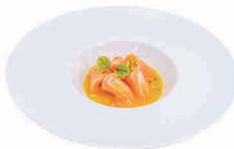
PS24.SAKE PASSION FRUITS € 6.00

salmone scottato,salsa mango,pistacchio seared salmon,mango sauce,pistachio gebratener lachs,mangosauce,pistazien