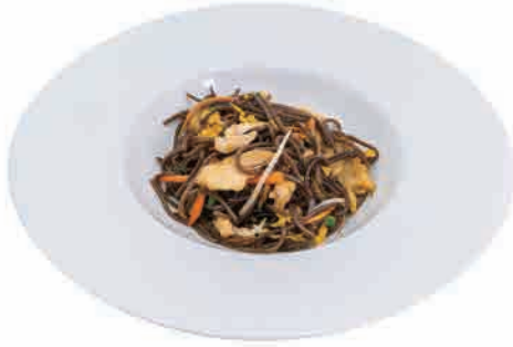
P07.YAKI SOBA POLLO € 6.00

spaghetti di grano saraceno, verdure, uova e gamberi buckwheat noodles, vegetables, eggs and shrimps buchweizennudeln, gemüse, eier und garnelen