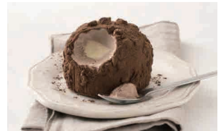
D11.TARTUFO CLASSICO € 5.00