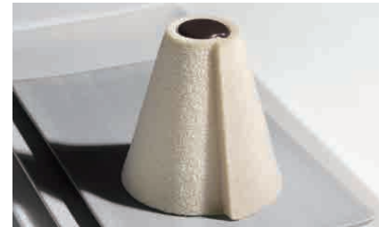
D08.GIROTONDO ALLE MANDORLE € 7.00