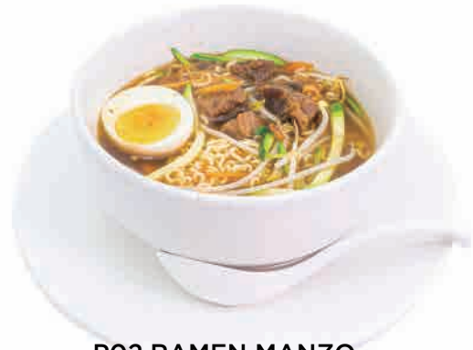
P02. RAMEN MANZO € 6.00

spaghetti di grano duro in brodo con verdure, gamberi, surimi, calamari e uovo wheat noodles in vegetables soup, shrimps, surimi, squids and eggs hartweizenspaghetti in brühe mit gemüse, garnelen, surimi, tintenfisch und eier