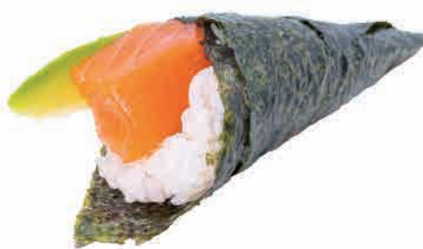
TO4.TEMAKI SALMONE E AVOCADO

salmone e avocado,philadelphia salmon and avocado,philadelphia lachs und avocado,philadelphia