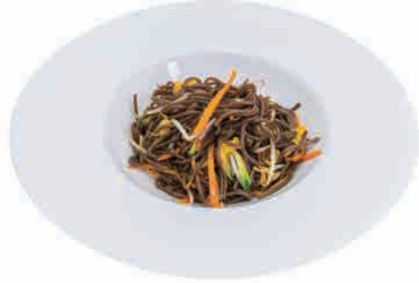
P08.YAKI SOBA VERDURE € 6.00

spaghetti di grano saraceno, verdure, uova e pollo buckwheat noodles, vegetables, eggs and chicken buchweizennudeln, gemüse, eier und huhn