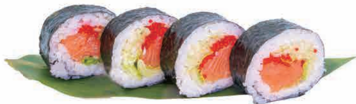
F05.FUTO MISTO € 5.00

gamberi in tempura,maionese,salsa teriyaki shrimp tempura,mayonnaise,teriyaki sauce tempura-garnelen,mayonnaise,teriyaki-sauce