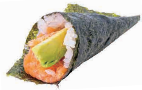
TO8.TEMAKI SPICY SAKE

gambero crudo,avocado raw shrimp,avocado rohe garnelen,avocado