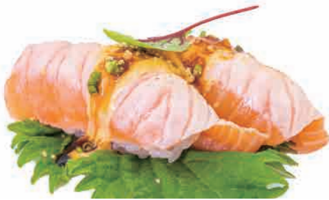
N09.NIGIRI SAKE PICCANTE € 7.00

salmone scottato,philadelphia,mandorle,teriyaki seared salmon,philadelphia,almonds,teriyaki gebratener lachs,philadelphia,mandeln,teriyaki