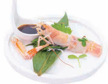
PS3.BRANZINO SCAMPI € 6.00

salmone, mango, philadelphia, salsa speciale salmon, mango philadelphia, special sauce lachs, mango, philadelphia, spezielsauce