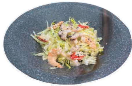
A06.INSALATA MISTO MARE € 5.00

alghe,gamberi,salmone,polpa di granchio seaweed,shrimps,salmon,crab sticks algen, garnelen, lachs, krabbenfleisch