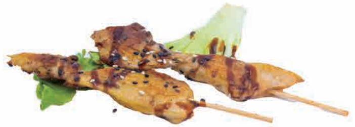
S08.YAKI TORI € 6.00 / 5pz

pollo alla piastra con salsa grilled chicken with sauce gegrilltes hähnchen mit soße