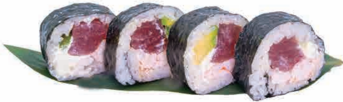
F03.AIMAKI € 5.00

gambero e tonno cotto,avocado e maionese cooked shrimp and tuna,avocado and mayonnaise garnelen und gekochter thunfisch,avocado und mayonnaise