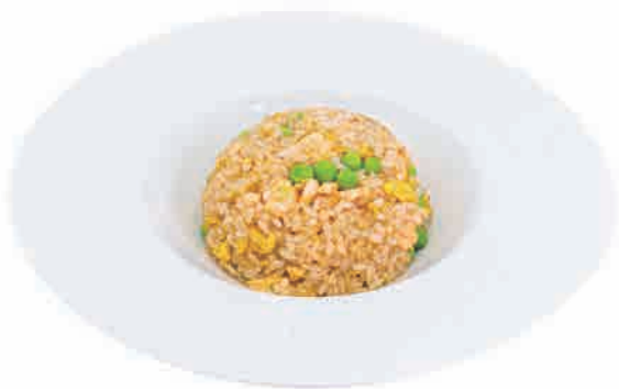
P13.RISO CON SALMONE € 6.00

riso con salmone,piselli e uova rice with salmon,peas and eggs reis mit lachs, erbsen und eiern