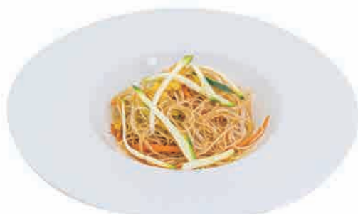
P17.SPAGHETTI DI RISO € 6.00

carote,zucchine,germogli di soia e uova carrots,zuchinis,beans sprouts and eggs karotten,zucchini, sojasprossen und eier