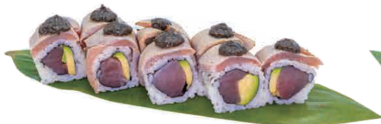
U23.URAMAKI CRAZY TUNA € 8.00

salmone,philadelphia,mango salmon,philadelphia,mango lachs,philadelphia,mango