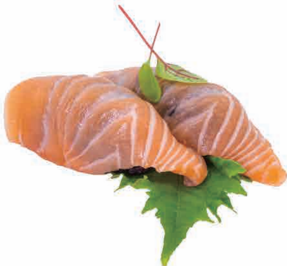
N13.NIGIRI BLACK € 7.00

salmone scottato,salsa piccante,teriyaki,grana seared salmon,hot sauce,teriyaki,grana gebratener lachs,scharfe sauce,teriyaki,parmesan