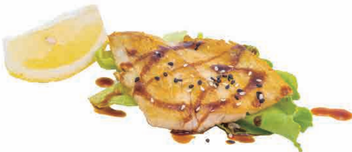
S13.SUZUKI TEPPANYAKI € 6.00

salmone alla piastra con salsa grilled salmon with sauce gegrillter lachs mit soße