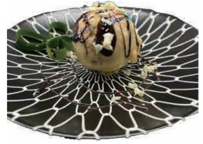
D04.GELATO FRITTO NOCCIOLA € 4.50