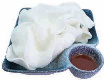
A15. NUVOLETTE DI DRAGO € 5.00

nuvolette di drago dragon clouds drachenwolken