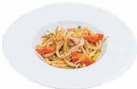
P03. YAKI UDON POLLO € 6.00

spaghetti di grano duro in brodo con manzo, uovo, verdure wheat noodles in meat soup, egg, vegetables hartweizenspaghetti in brühe mit rindfleisch, eier, gemüse