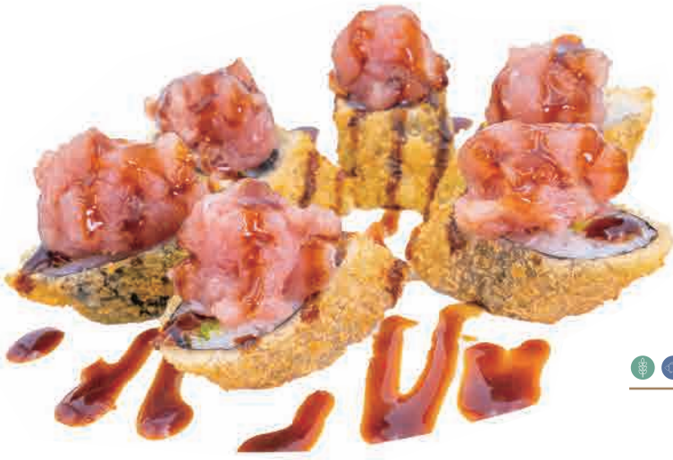
H08.HOSO TUNA FURAI € 6.00

hoso fritto con avocado,tartare di tonno e teriyaki fried hoso with avocado,tuna,teriyaki frittierter hoso mit avocado,hunfisch,teriyaki