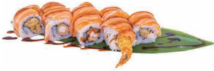
U17.URAMAKI TIGER € 8.00

gamberi in tempura,salmone,teriyaki shrimp tempura,salmon,teriyaki tempura-garnelen,lachs,teriyaki