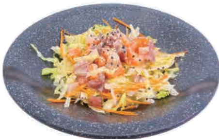
A6a.INSALATA MISTO PESCE € 5.00

insalata,pomodoro,gamberetti cotti e polpa di granchio,salsa sesamo salad,tomato,cooked shrimps and crab sticks,sesame sauce salat, tomaten, gekochte garnelen und krabbenfleisch, sesamsauce