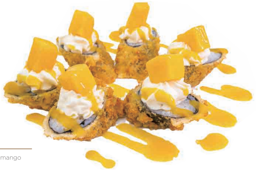
H09.HOSO PHILA MANGO € 6.00

hoso fritto con avocado,tartare di tonno e teriyaki fried hoso with avocado,tuna,teriyaki frittierter hoso mit avocado,hunfisch,teriyaki