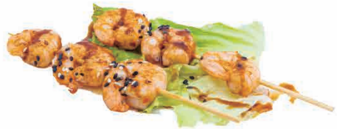
S10.YAKI EBI € 6.00 / 5pz

spiedini di seppioline alla piastra grilled baby cuttlefish skewers gegrillte tintenfischspieße