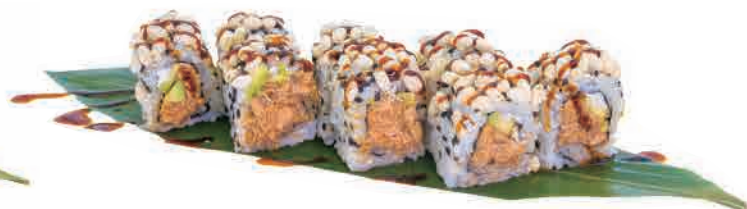
U06.URAMAKI SAKE CEREALI

tonno,avocado,sesamo tuna,avocado,sesame thunfisch,avocado,sesam