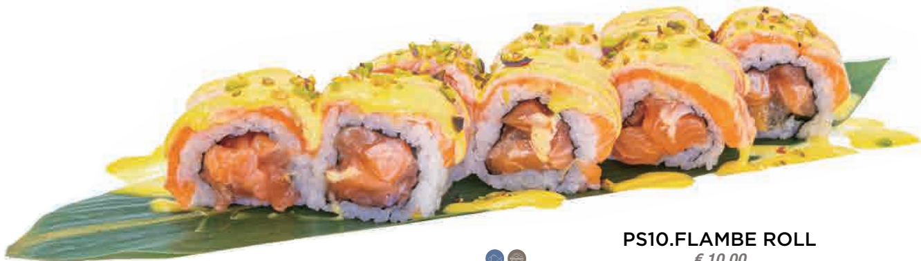
PS10.FLAMBE ROLL € 10.00

salmone,salsa passion fruits salmon,passion fruits sauce lachs,maracuja-sauce