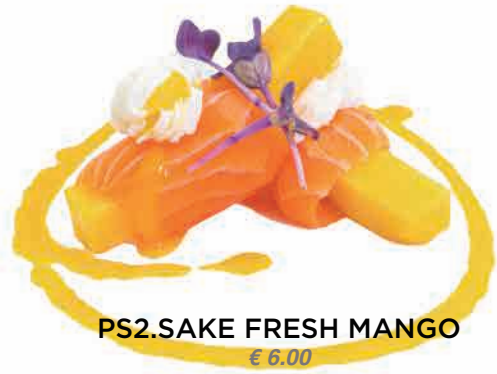
PS2.SAKE FRESH MANGO € 6.00

salmone, fiori di zucca fritto, teriyaki salmon, fried courgette flower, teriyaki lachs, frittiertes zucchini Blüten, teriyaki