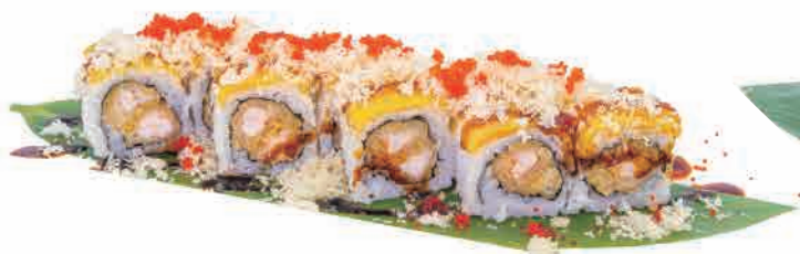
PS14.MANGO ROLL € 10.00

scampi,pera,salmone,schiuma,teriyaki langoustines,pear,salmon,foam,teriyaki langusten,birne,lachs,schaum,teriyaki