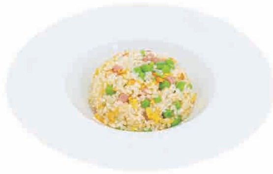
P14.RISO ALLA CANTONESE € 6.00

riso con salmone,piselli e uova rice with salmon,peas and eggs reis mit lachs, erbsen und eiern