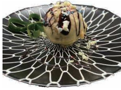
D03.GELATO FRITTO FIOR DI LATTE € 4.50