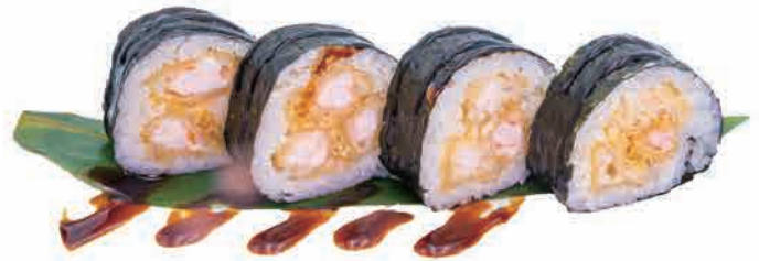
F04.FUTO EBI € 5.00

tonno,gamberi cotti,philadelphia e avocado tuna,cooked shrimps,philadelphia and avocado thunfisch, gekochte garnelen,philadelphia und avocado