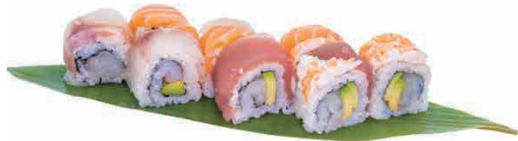
U18.URAMAKI ARCOBALENO € 8.00

gamberi in tempura,salmone,teriyaki shrimp tempura,salmon,teriyaki tempura-garnelen,lachs,teriyaki