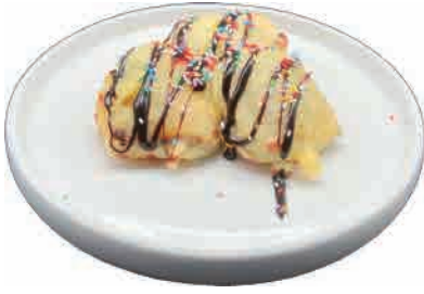
D02.NUTELLA FRITTA € 4.50