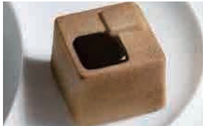
D07.CUBO AI DUE CIOCCOLATI € 7.00