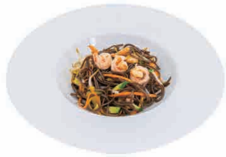
P06.YAKI SOBA GAMBERI € 6.00

spaghetti udon di grano con gamberi, calamari, surimi e verdure udon wheat noodles with shrimps, squids, surimi and vegetables weizen-udon-nudeln mit garnelen, tintenfisch, surimi und gemüse