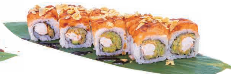
PS15.EBI ROLL € 10.00

gamberi cotti,fior di zucca fritto,tartare di salmone,teriyaki cooked shrimps,fried courgette flower,salmon tartare,teriyaki gekochte garnelen,frittiertes zucchini Blüten,lachstatar,teriyaki