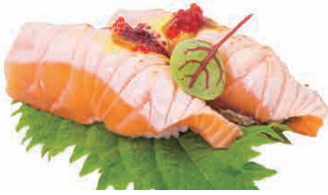
N07.NIGIRI CHEESE € 7.00

salmone scottato,salsa cheese,teriyaki,tobiko seared salmon,cheese sauce,teriyaki,tobiko gebratener lachs,käsesauce,teriyaki,tobiko