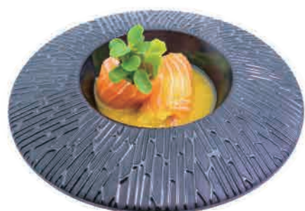
PS22.INVOLTINI INSALATA € 6.00

salmone, rucola, salsa ponzu salmon, rocket, ponzu sauce lachs, rucola, ponzu-sauce