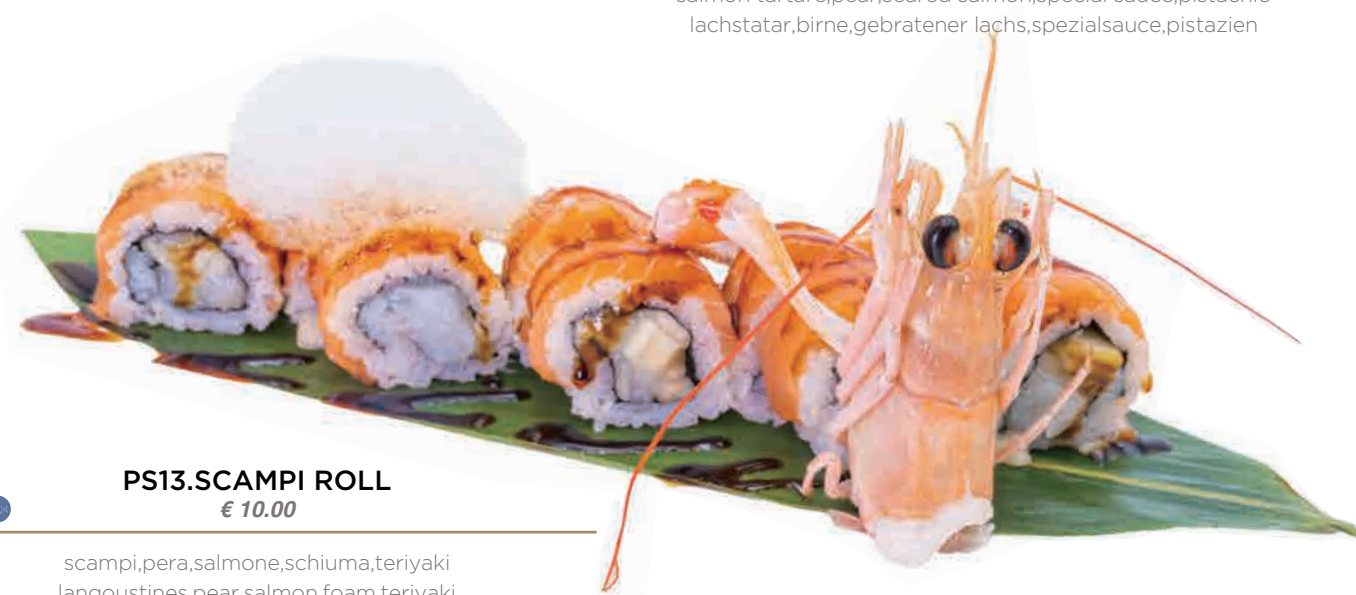
PS13.SCAMPI ROLL € 10.00

tartare di salmone,pera,salmone scottato,salsa speciale,pistacchio salmon tartare,pear,seared salmon,special sauce,pistachio lachstatar,birne,gebratener lachs,spezielsauce,pistazien