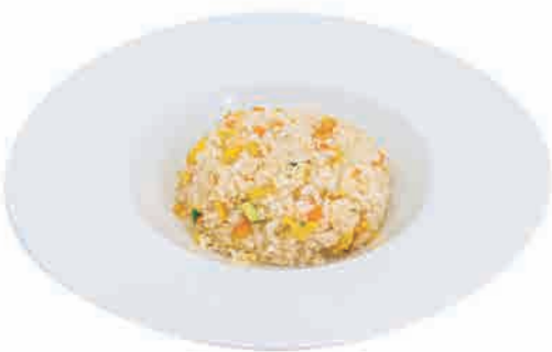
P12.RISO CON VERDURE € 6.00

riso con pollo, verdure e uova rice with chicken, vegetables and eggs reis mit huhn, gemüse und eiern