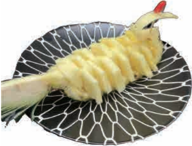
D05.ANANAS € 4.50