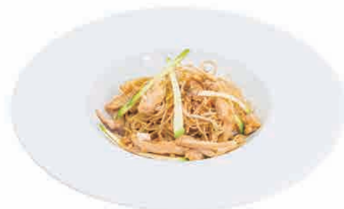
P18.SPAGHETTI DI RISO CON POLLO € 6.00

carote,zucchine,germogli di soia e uova carrots,zuchinis,bean sprouts and eggs karotten, zucchini, sojasprossen und eier