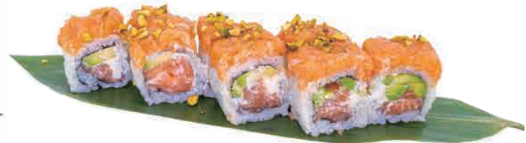
U20.URAMAKI ROCK ROLL € 8.00

gamberi tempura,salmone scottato,maionese,teriyaki,sesamo shrimp tempura,seared salmon,mayonnaise,teriyaki,sesame tempura-garnelen,gebratener lachs,mayonnaise,teriyaki,sesam