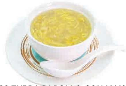
A02.ZUPPA DI POLLO CON MAIS € 5.00

miso,tofu,erba cipollina e alghe miso,tofu,chives and seaweed miso,tofu,schnittlauch und algen