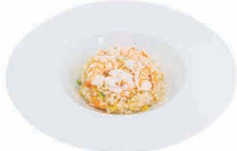
P10.RISO CON GAMBERI € 6.00