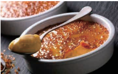
D09.CREMA CATALANA IN COCCIO € 5.00