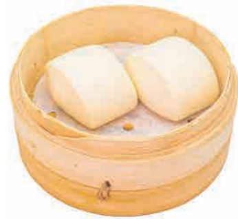
A17. PANE CINESE € 5.00

nuvolette di drago dragon clouds drachenwolken