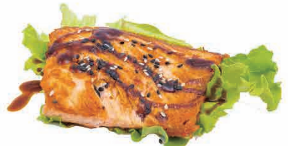
S12.SAKE TEPPANYAKI € 6.00

spiedini di agnello alla griglia grilled lamb skewers lammspieße auf dem grill