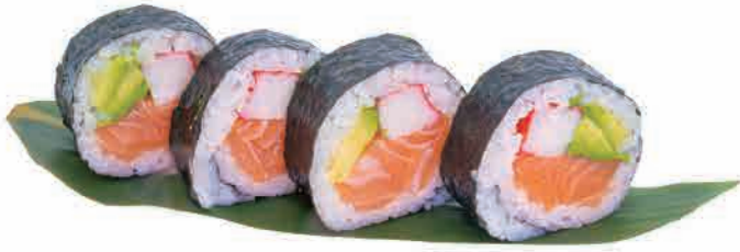
F01.KIREIMAKI € 5.00

salmone,polpa di granchio,avocado salmon,crab stick,avocado lachs,krebsfleisch,avocado