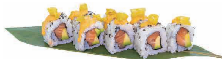
U08.URAMAKI SPICY SAKE

surimi,avocado,tobiko,maionese surimi,avocado,tobiko,mayonnaise surimi,avocado,tobiko,mayonnaise