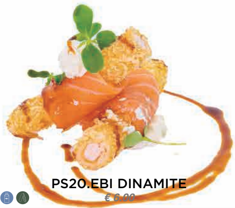
PS20.EBI DINAMITE € 6.00

carpaccio di branzino, scampi con salsa ponzu carpaccio of sea bass, langoustines with ponzu sauce wolfsbarsch-carpaccio, scampi mit ponzu-sauce