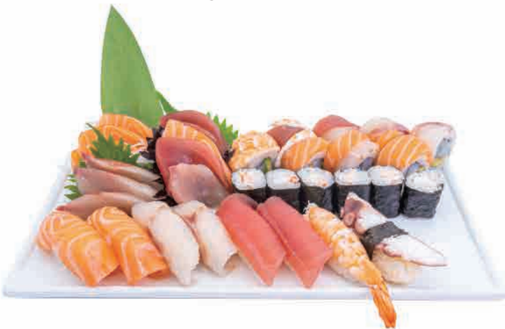
SM3.SUSHI BIG 34PZ