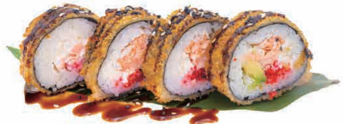
F06.FUTO FRITTO € 6.00

cetriolo,salmone,insalata,uova di pesce volante cucumber,salmon,salat,flying fish roe gurke,lachs,salat,flugfischrogen