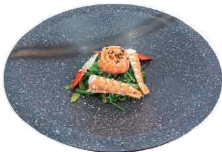
A05.WAKAME MISTO MARE € 5.00

alghe agropicanti hot and sour seaweed würzig süß und sauer-algen-algen