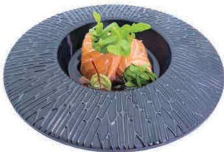
PS21.INVOLTINI RUCOLA € 6.00

sashimi di tonno scottato, prezzemolo, salsa piccante, schiuma sashimi of seared tuna, parsley, hot sauce, foam gebratenes Thunfisch-sashimi, Petersilie, scharfe Soße, schaum