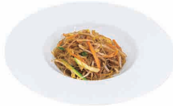
P16.SPAGHETTI DI SOIA CON VERDURE € 6.00

spaghetti di soia con gamberi e verdure glass noodles with shrimps and vegetables sojanudeln mit garnelen und gemüse