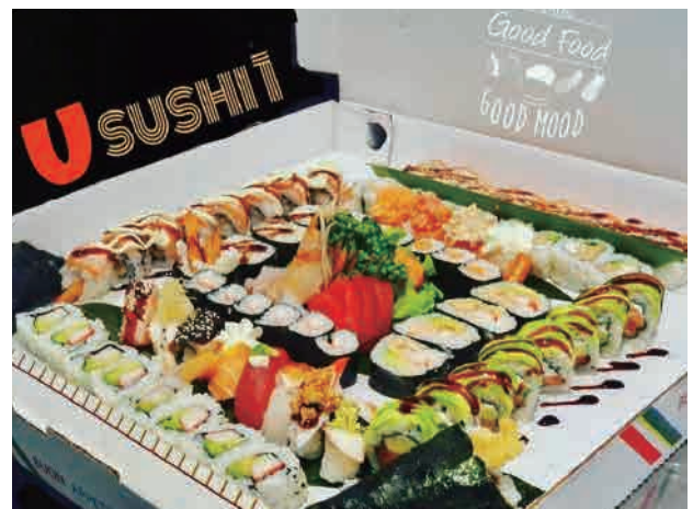
SM6.SUSHI MEZZO METRO 80PZ

4 gunkan,6 hoso,16 ura,14 sashimi,10 nigiri