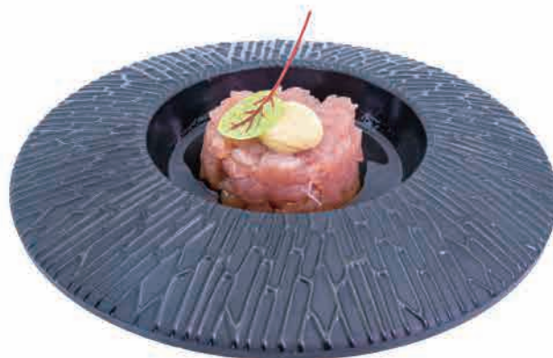
C2.TARTARE DI TONNO

salmone salsa ponzu ,avocado salmon,ponzu sauce,avocado lachs-ponzu-sauce,avocado