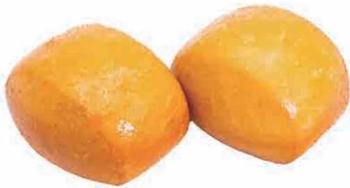
A18. PANE FRITTO € 5.00

pane cinese al vapore steamed chinese bread gedämpftes chinesisches brot