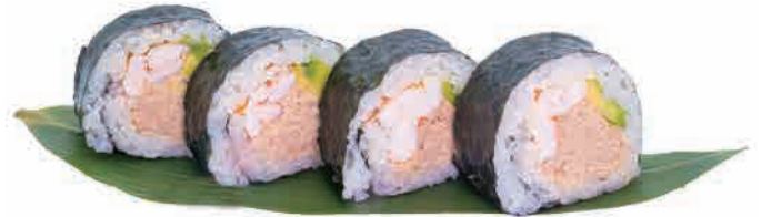
F02.FUTO CALIFORNIA € 5.00

salmone,polpa di granchio,avocado salmon,crab stick,avocado lachs,krebsfleisch,avocado