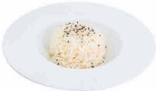
P09.RISO BIANCO € 6.00

spaghetti di grano saraceno, verdure e uova buckwheat noodles, vegetables and eggs buchweizennudeln, gemüse und eier