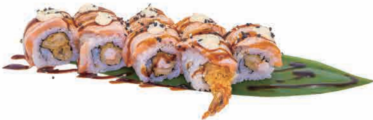
U19.URAMAKI TIGER FLAMBE € 8.00

pesce misto,avocado,gambero crudo mixed fish,avocado,raw shrimp gemischter fisch,avocado,rohe garnelen