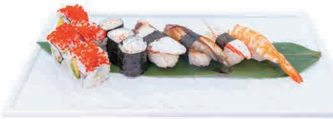
SM1.SUSHI HAPPY 12PZ