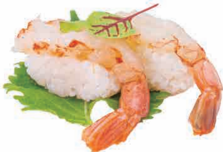
N11.NIGIRI AMAEBI € 6.00

salmone scottato,salsa rucola,pistacchio,teriyaki seared salmon,rocket sauce,pistachio,teriyaki gebratener lachs,rucolasauce,pistazien,teriyaki