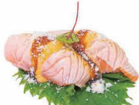
N12.NIGIRI GRANA € 7.00

salmone scottato,salsa piccante,teriyaki,grana seared salmon,hot sauce,teriyaki,grana gebratener lachs,scharfe sauce,teriyaki,parmesan