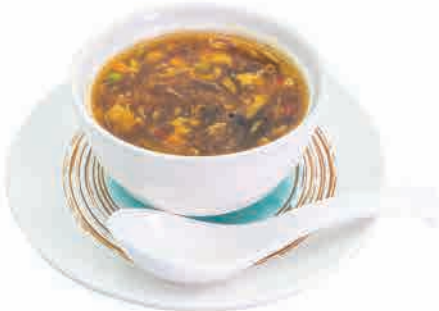
A03.ZUPPA AGROPICCANTE € 5.00

mais,pollo,uova corn,chicken,eggs mais, huhn, eier