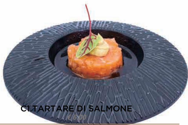
C1.TARTARE DI SALMONE