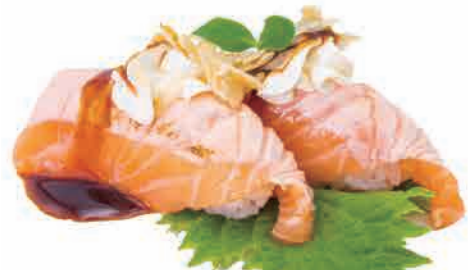
N08.NIGIRI SAKE FLAMBE € 7.00

salmone scottato,salsa cheese,teriyaki,tobiko seared salmon,cheese sauce,teriyaki,tobiko gebratener lachs,käsesauce,teriyaki,tobiko