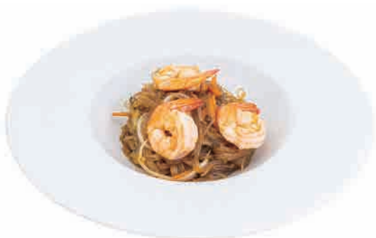
P15.SPAGHETTI DI SOIA CON GAMBERI € 6.00

piselli,prosciutto cotto e uova peas,ham and eggs erbsen, gekochter schinken und eier