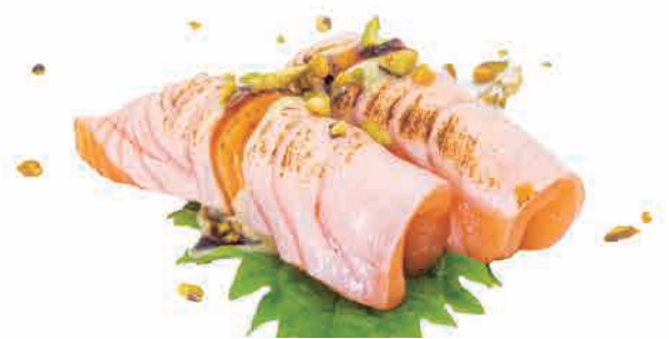
N10.NIGIRI RUCOLA FLAMBE € 7.00

salmone scottato, salsa speciale piccante,erba cipollina,arachidi,teriyaki seared salmon,special spicy sauce,chives,peanuts,teriyaki gebratener lachs, spezielle scharfe sauce,schnittlauch,erdnüsse,teriyaki