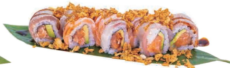
U24.URAMAKI JAPAN FLAMBE € 8.00

tonno,avocado,salsa teriyaki,tonno flambe e tartufo tuna,avocado,teriyaki sauce,tuna flambe and truffler thunfisch,avocado,teriyaki-Sauce,flambierter,thunfisch und trüffel