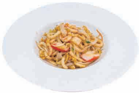
P05.YAKI UDON FISH € 6.00