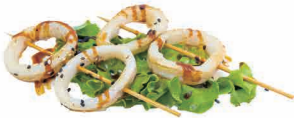
S09.YAKI IKA € 6.00 / 5pz

spiedini di pollo alla piastra con salsa grilled chicken skewers with sauce gegrillte hähnchenspieße mit soße