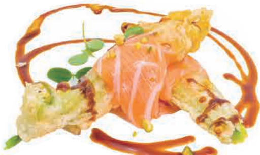
PS1.FIOR DI ZUCCA FRITTO € 6.00

salmone, fiori di zucca fritto, teriyaki salmon, fried courgette flower, teriyaki lachs, frittiertes zucchini Blüten, teriyaki