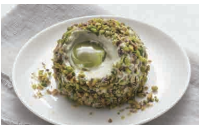
D12.TARTUFO PISTACCHIO € 5.00