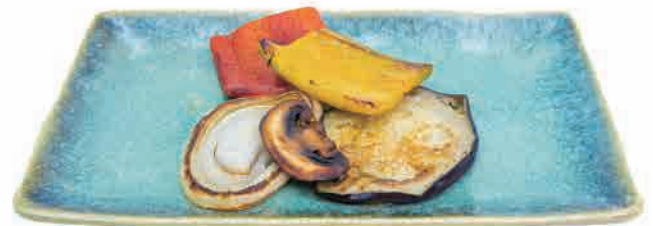
S14.VERDURE MISTE TEPPANYAKI € 6.00

branzino alla piastra con salsa grilled sea bass with sauce gegrillter wolfsbarsch mit sauce