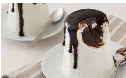
D15.MENTA CIOCCOLATO € 4.00