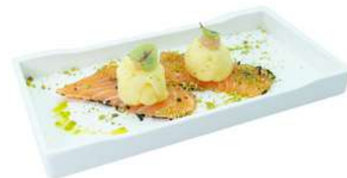
Z6 Sake patata 4pz patata, tataki salmone, pistacchio e salsa tokarashi (1) (4) (8) €6.00