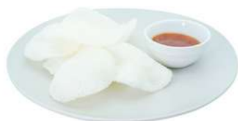
A1 Nuvole di drago patatine al gusto gambero (2) €6.00