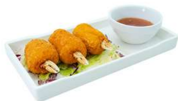
A7 Chele di granchio 4pz (1) (2) €6.00