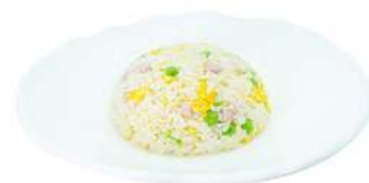
P3 Riso Cantonese