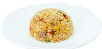
P5 Riso con manzo