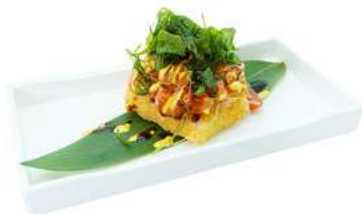
Z8 Crisp salmon 2pz riso fritto, tartare di salmone, rucola frita, pomodoro, salsa mango, salsa teriyaki (1) (4) (6) €7.00