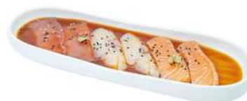
M5 Carpaccio sake