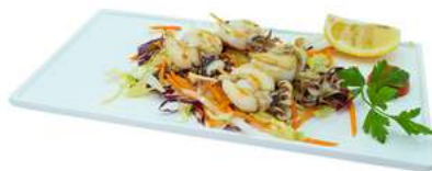
S45 Yaki Ika 5pz