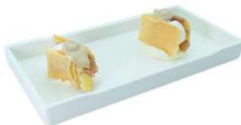
Z2 Millefoglie tuna 6pz chips croccante, tonno, bufala, carciofi e salsa tartufo (1) (4) €7.00