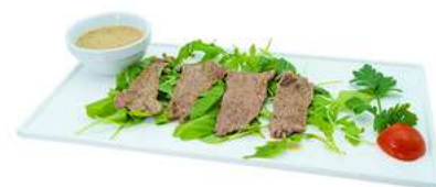
A9 Rucola beef manzo alla piastra su letto di rucola (11) €6.00