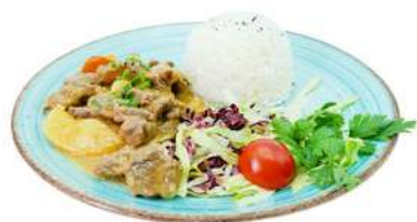
P7 Manzo thai donburi