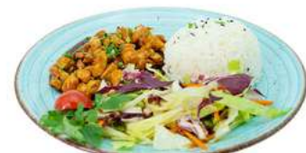
P6 Pollo donburi