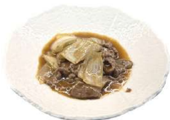
S18 Manzo con cipolla manzo e cipolla in salsa (1) (6) €7.00