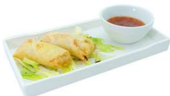
A2 Involtini primavera 4pz cavolo, cipolla, carote (1) (3) €6.00