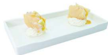
Z3 Millefoglie ebi 6pz chips croccante, gambero crudo, bufala, frutta, salsa avocado, salsa yuzu (2) €7.00