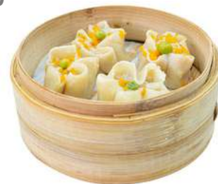
A12 Shaomai 4pz carne suina e gamberi (1) (2) (4) €6.00