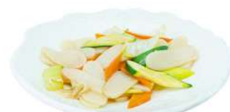
P12 Gnocchi di riso verdure