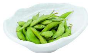
A3 Edamame fagioli di soia (6) €6.00