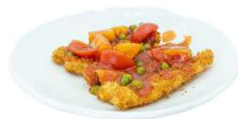
S16 Pollo agrodolce pollo fritto con salsa agrodolce (1) €7.00