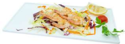
S44 Yaki ebi 5pz