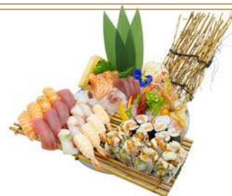
SM1 Nigiri Selection 5pz