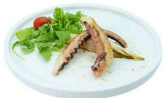
S47 Tako teppanyaki