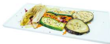
S48 Yasai teppanyaki