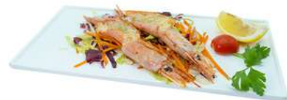
S43 Gamberoni teppanyaki