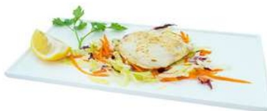
S42 Suzuki teppanyaki