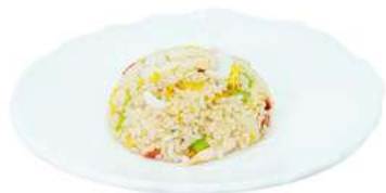
P4 Riso con frutti di mare

verdure, gamberi, calamari e uova (1) (2) (3) (4) (14)