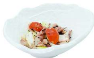
A8 Tako wasabi polipo, cetrioli, pomodorini e salsa aromatizzata al wasabi (1) (14) €6.00