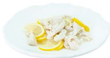
S15 Pollo limone pollo in salsa limone €7.00