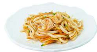
P9 Udon ebi

spaghetti udon con verdure e gamberi (1) (2) (4)