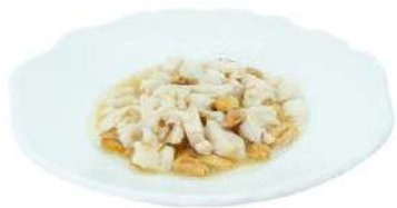
S11 Pollo mandorle pollo con mandorle (1) (6) (8) €7.00