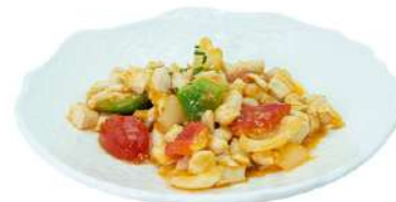
S13 Pollo piccante pollo, peperoni, cipolla e arachidi (8) €7.00