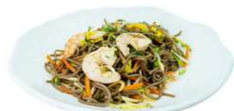
P11 Soba ebi

spaghetti di grano saraceno con verdure, gamberi e uova (1) (2) (3)