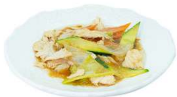
S14 Pollo verdure pollo, carote, zucchine e cipolla €7.00