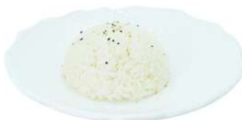
P2 Riso bianco