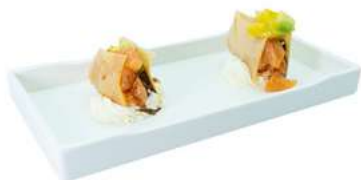
Z1 Millefoglie salmon 6pz chips croccante, salmone, bufala, oliva e salsa balsamico, frutta mista (1) (4) €7.00