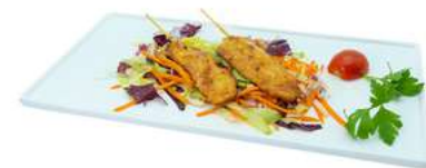
S46 Yaki tori 6pz