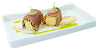
Z5 Tataki tuna 4pz patata avvolta nel tataki tonno e salsa tokarashi (1) (4) €6.00