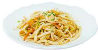
P10 Udon spicy

spaghetti udon con verdure, pollo, uova e piccante (1) (3)