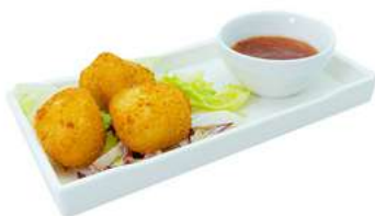
A5 Polpette di patate 5pz patata e mais (1) (3) (7) €6.00