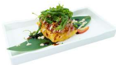
Z9 Crisp maguro 2pz riso fritto, tartare di tonno, rucola frita, pomodoro, salsa mango e teriyaki (1) (4) (6) €7.00