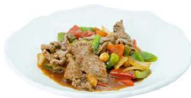
S19 Manzo piccante manzo peperoni, cipolla e arachidi (5) €7.00