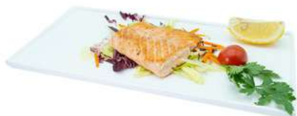
S41 Sake teppanyaki