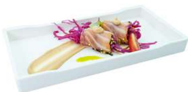
Z4 Tataki sake 4pz cavolo viola avvolta nel tataki salmone e salsa tokarashi (1) (4) €6.00