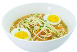
P1 Ramen in brodo