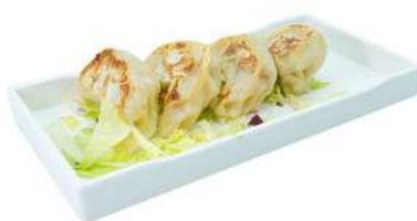
A11 Gyoza alla piastra 4pz carne suina e verdure (1) (11) €6.00